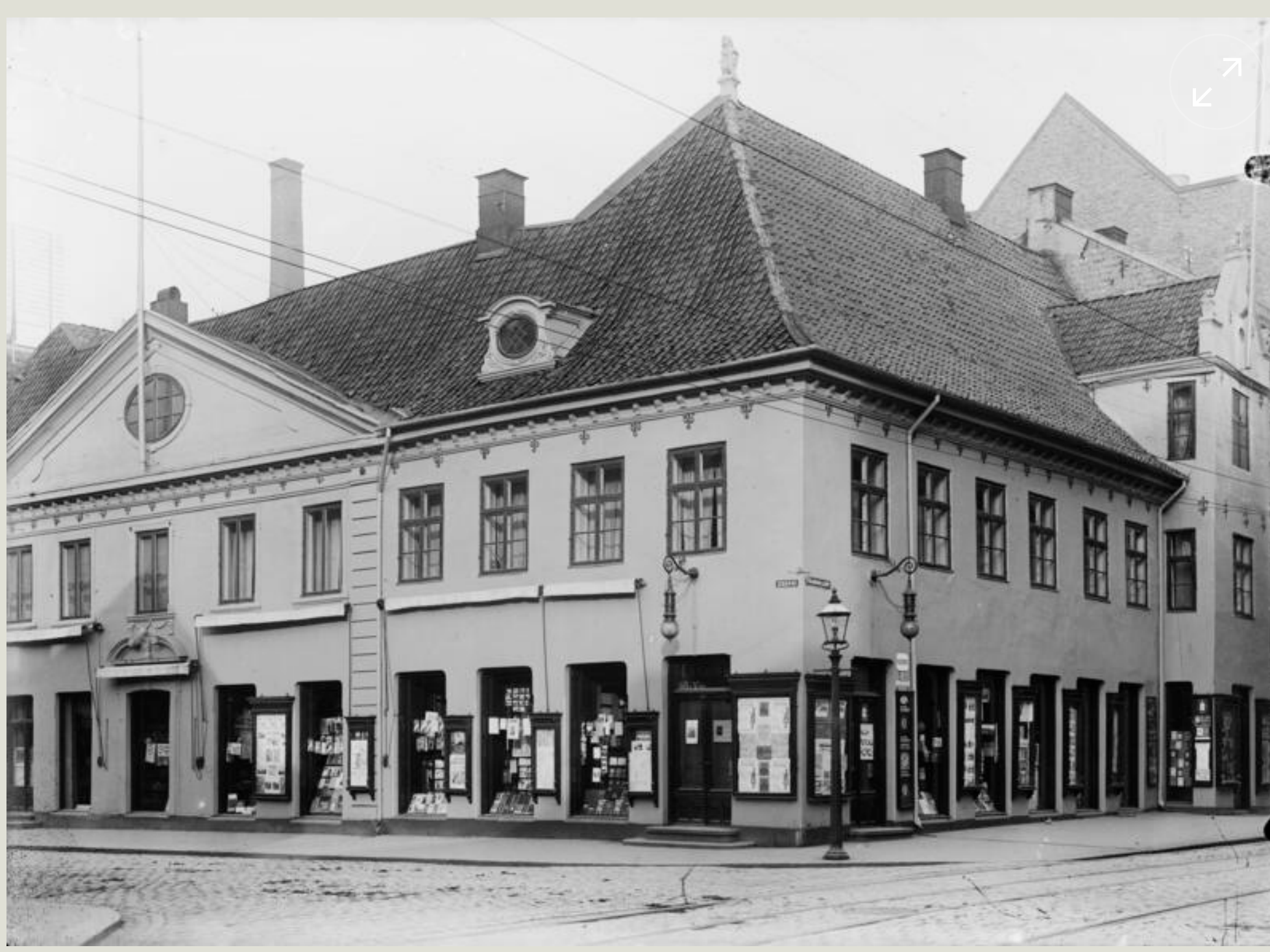
Collettgården, ca. 1915

I årene omkring 1920 var Collettgårdens skjebne gjenstand for intense diskusjoner.