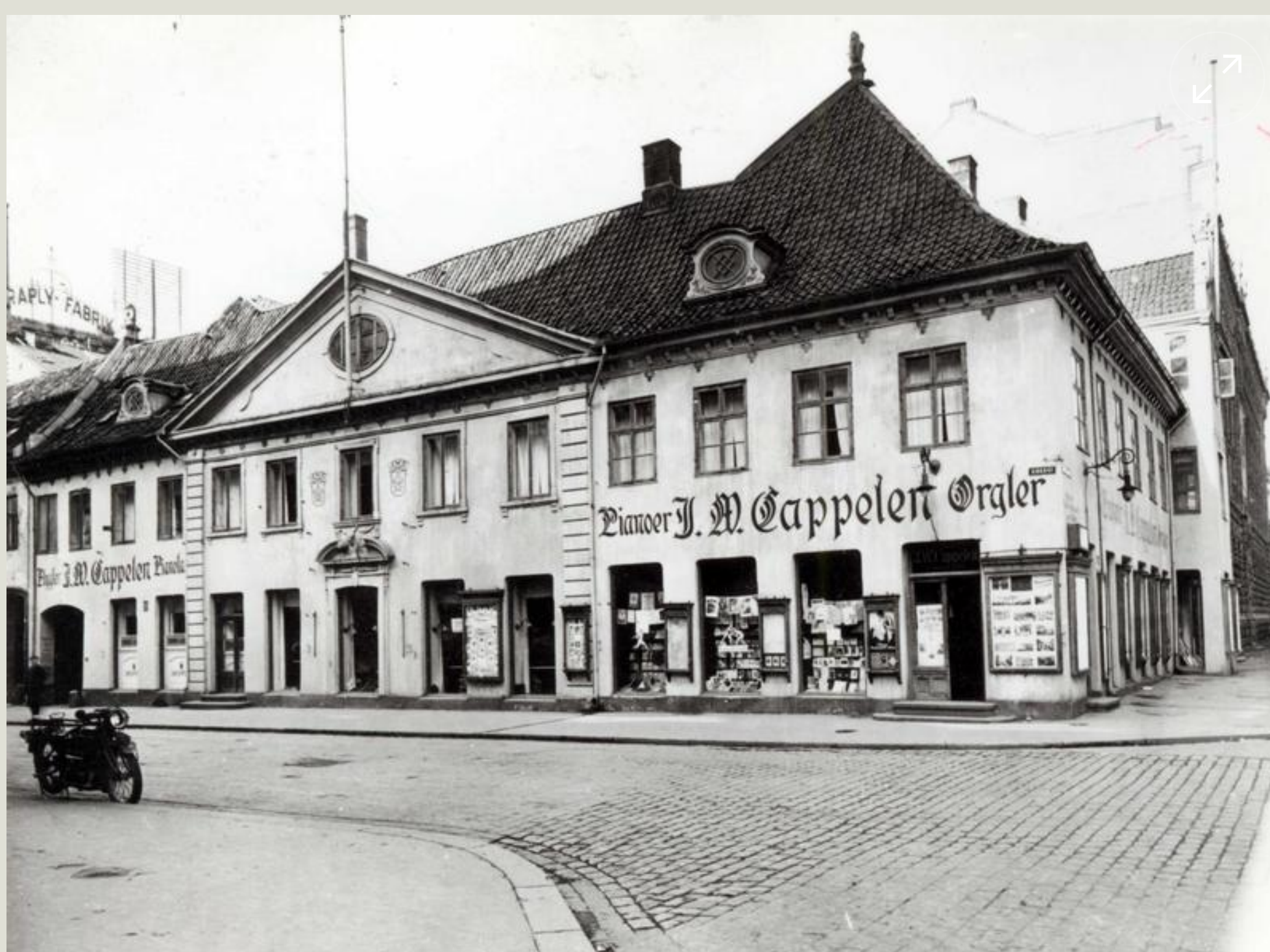
Collettgården, 1924.

Aars påpekte at det var uøkonomisk å oppføre et gammelt toetasjes hus på en verdifull tomt hvor det burde bygges et nybygg på 5-6 etasjer. Han mente dessuten at det var galt å skape et historisk torginteriør som aldri hadde eksistert. – «Det hele smager af kuliseer og theater.»