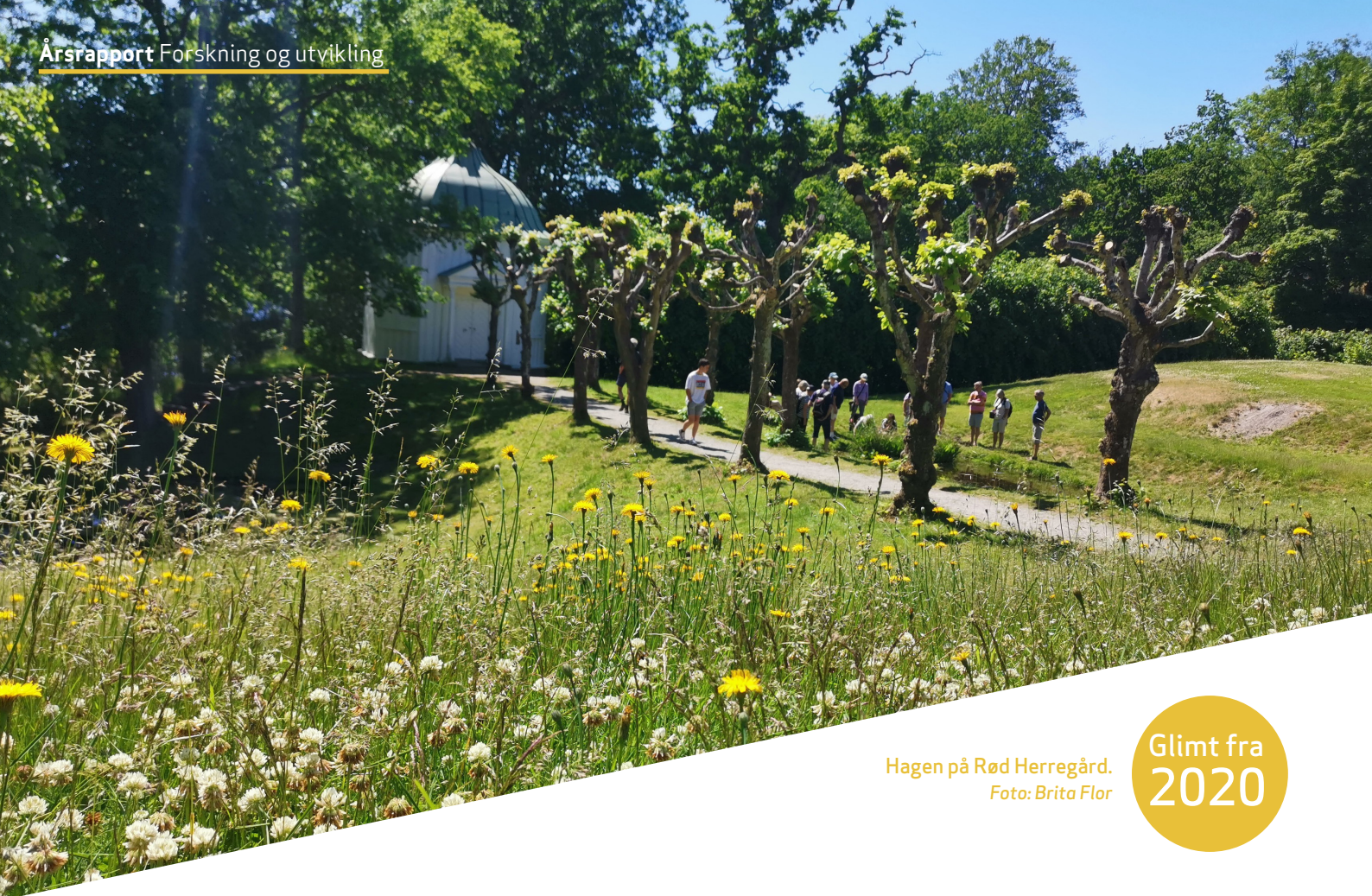
Hagen på Rød Herregård.