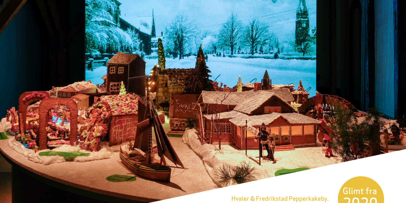
Hvaler & Fredrikstad Pepperkakeby.