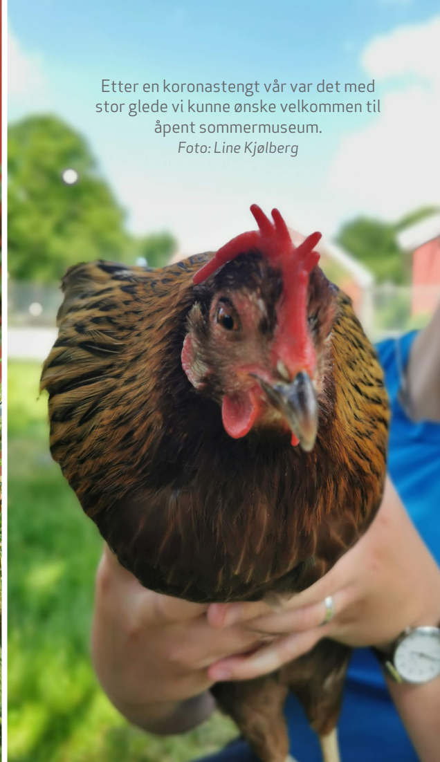
Etter en koronastengt vår var det med stor glede vi kunne ønske velkommen til åpent sommermuseum.