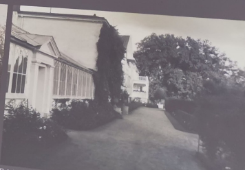
Drivhusdelen nærmest hagesalongen er fra 1862, inngang og vestre del fra ca. 1905.