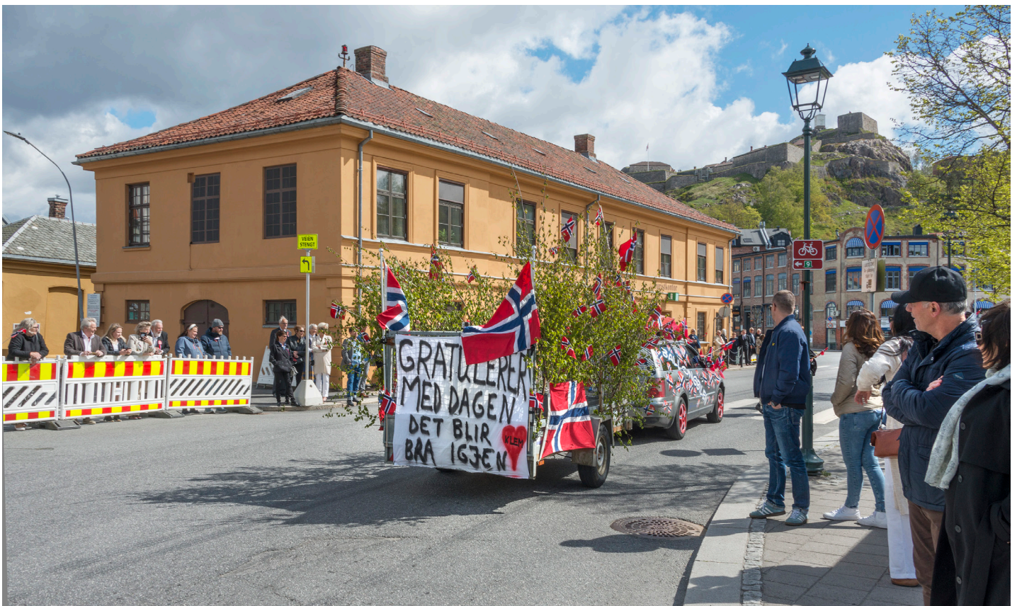
Det blir bra igjen. Fra 17. mai i Halden.