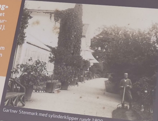
Gartner Stenmark med sylinderklipper rundt 1890.