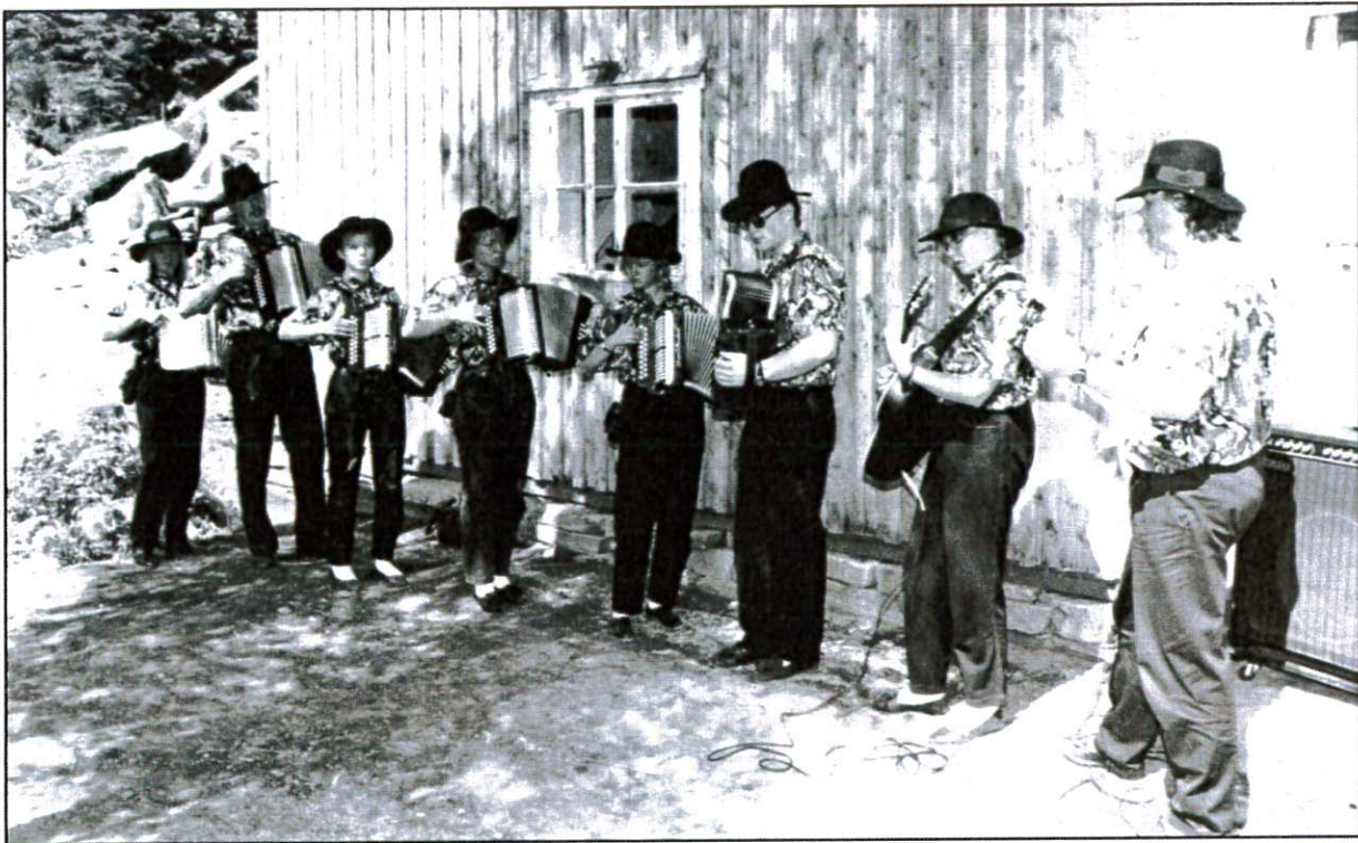
Lierne Toradergruppe sørget for lystige toner.

veichef Knut Andersens fraværelse, ledet af kontorchef Mads Almaas, efter Veidirektorens bemyndigelse. Paa distriktets vegne møtte ordfører Arnodd Lillemark.