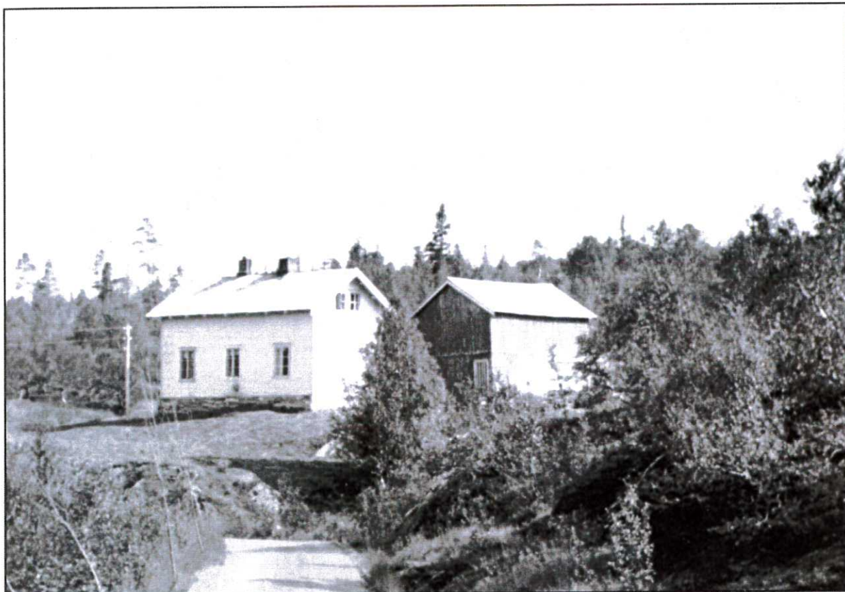
Gosen vegvokterbolig slik den en gang lå på Lifjellet.