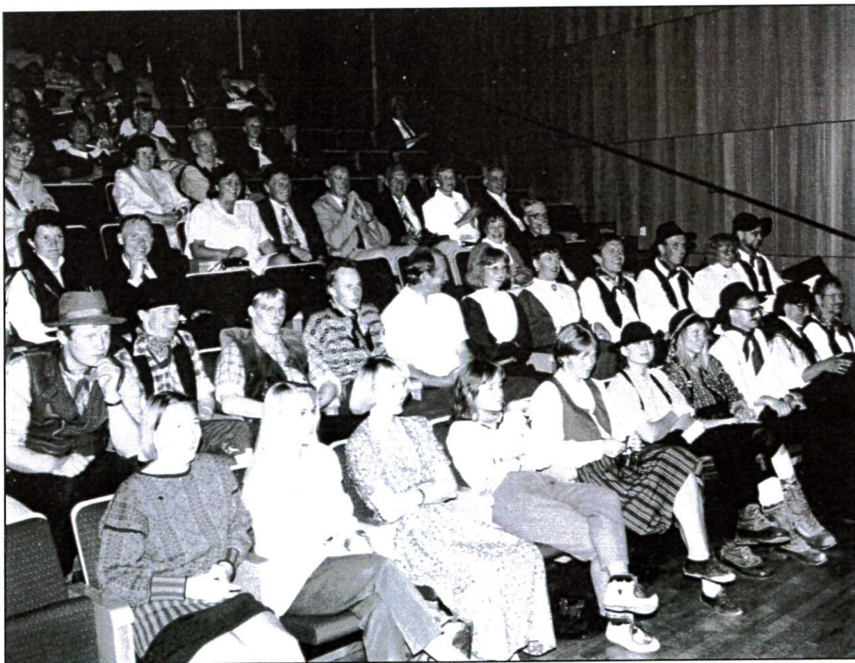
Mange hadde funnet vegen til auditoriet for å høre libygerne underholde.