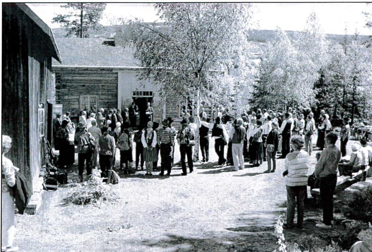
Det var folksomt i Gosen på gjenåpningsdagen.