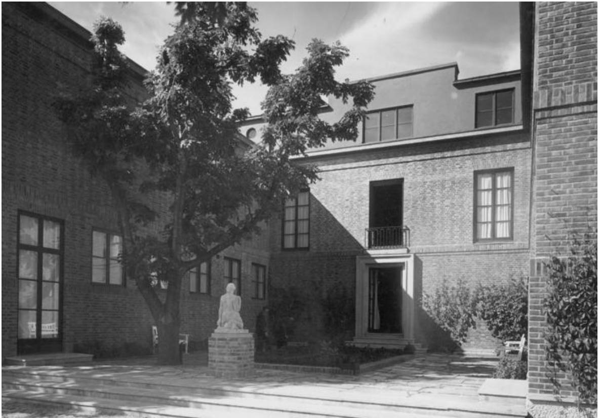
Trondheim kunstmuseums hovedbygning 1930, bakgården mot Vestfrontplassen og Nidarosdomen. Dette rommet forsvant da tilbygget sto ferdig i 1986.