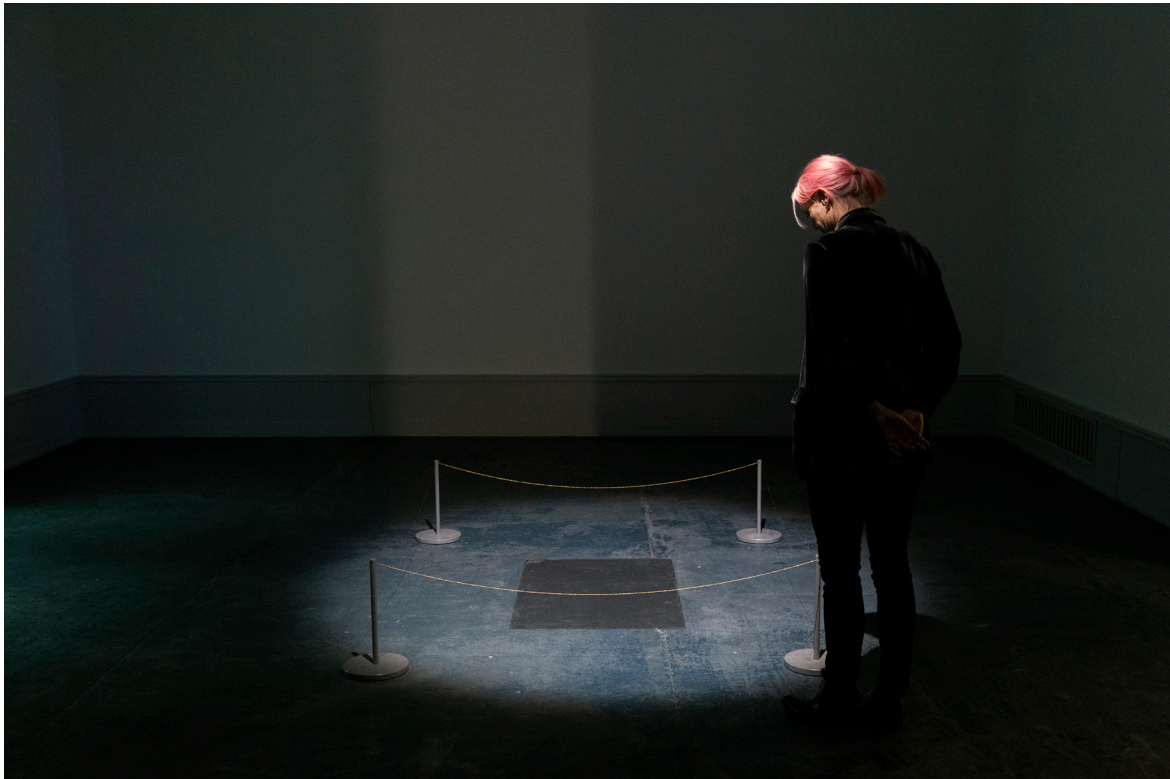
Gulvreparasjonen.