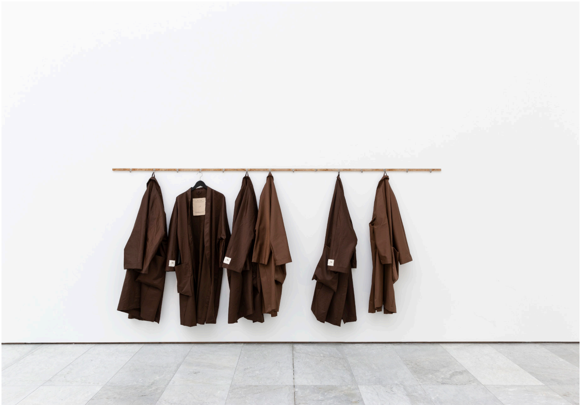
13 renser. Brannmannskapets dusjknaggerekke. / Til Alf. Åtte Nattfrakker i brun bevernylon. Kolleksjon 1. Opplag 8/30.