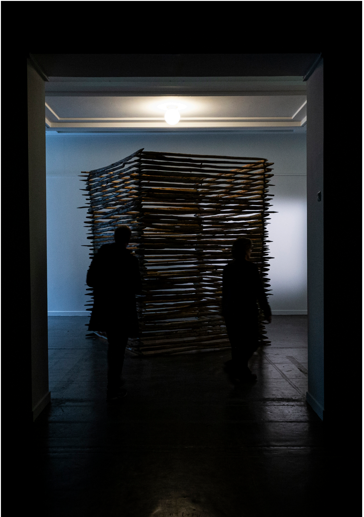
til bjørn ivar. rekonstruksjon av staurhytta vi bygde. bare at denne er uoverstigelig, uten tak, og bålet.