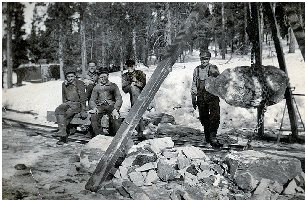
Stubbebryter på veianlegg 1936-37. Arbeiderne er bureisere og småbrukere.

og mye alvor. Det er et stort kapittel, forsømt å fortelle, men grunnleggende for voksenlivet hos alle sammen. Noen få levde ut lekedrømmen om gard, husdyr og familie og ble i jordbruket.