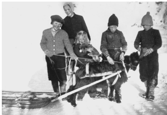
Barn i lek. Bureiserbarn kjørte med geitebukk som læring for voksenlivet.

Ikke alle bureisningsbruk var liv laga. Etter krigen ble den nasjonale politikken endret med satsing på industri og strukturrasjonalisering av jordbruket. Det førte i Sollia til at tre bruk ikke kom i gang og noen bruk raskt ble fraflyttet.