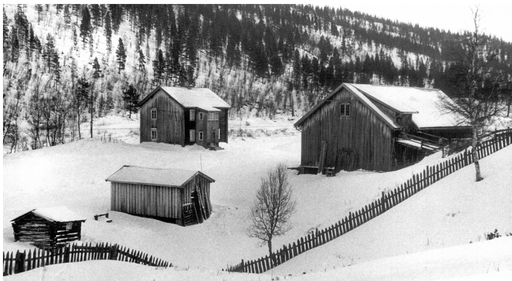
Sæther – bureisingsbruk ved Vulua. Foto: Bjørn Brænd 1975.

I Sollia ble 43 planer godkjent for bureising, de fleste i perioden 1918-39. Det ble nye gårder i alle bygdas grender. Det endret for alltid bygdas karakter og kulturlandskap. Med utgangspunkt i skogsmark, ofte i randsonen av eldre gårder, var det at bureiserfamilien ryddet skog, dyrket jord og bygde hus til en gård som kunne overlates til neste generasjon. Men det kom også endel nye bruk kilometervis uten vei til nærmeste nabo.