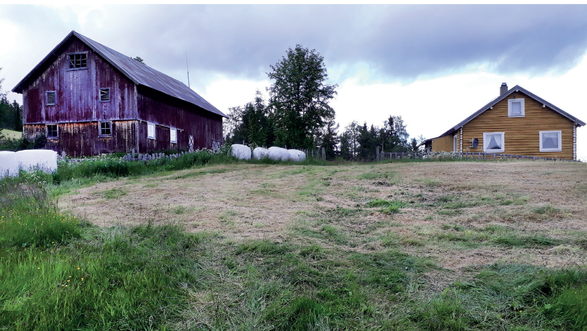
Opsal – bureisingsbruk fra 1939, i 2019 feriested.