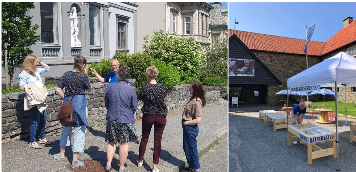
Byvandringar og barnas båtverksted har vært aktiviteter ved Bergens sjøfartsmuseum i 2020 når det ikke har vært stengt grunnet koronapandemien.

Museum Vest er et regionmuseum for kommunene Sund, Fjell, Øygarden, Askøy, Masfjorden og Bergen kommune. Samtidig er Museum Vest et tematisk museum der den faglige profilen utgår fra avdelingenes hovedfelt. Profilen utgjør tre hovedtemaer: Sjøfarts- og fiskerihistorie, havbruk og handel inkludert hanseatenes historie. Krig- og okkupasjon, forsvarshistorie og menneskerettigheter. Kystkultur med fokus på energihistorie.