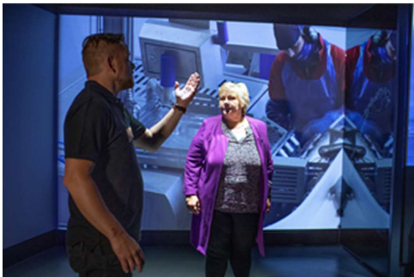
Statsminister Erna Solberg åpnet visningscenteret for havbruk Storeblå 20.august 2020