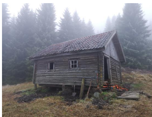
«Grisehuset» på Holo-setra