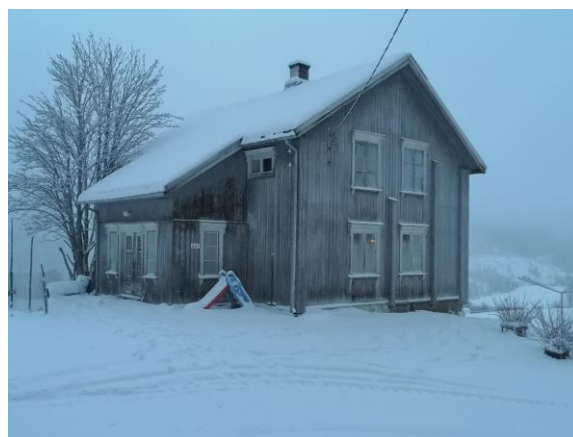
Fra Østre Sønsteby