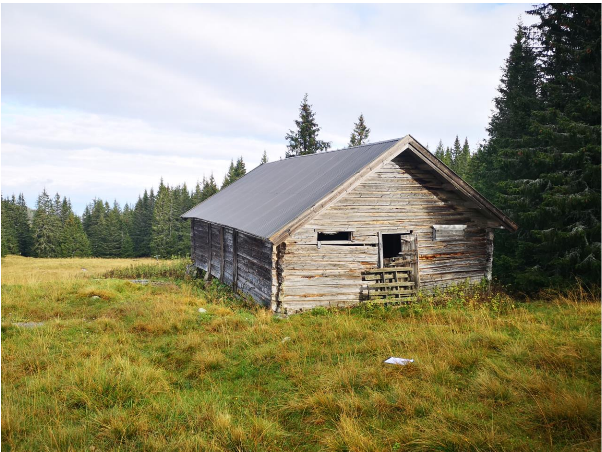
Fjøset i «Samsen» på Oppegårdssetra på Totenåsen