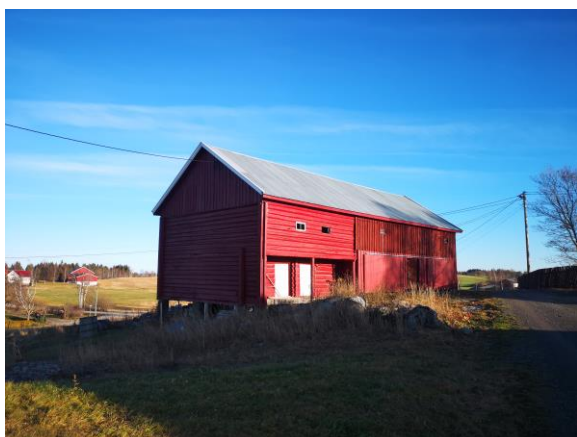
Stabbur på Kyseth