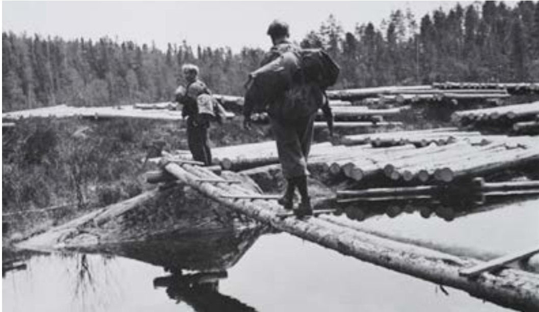
Max Manus og Gregers Gram på vei fra Grindforsmon.

veien. Kurérpost ble regelmessig frak- tet begge veier. Opplysninger om tyske konsentrasjoner, transporter, aksjoner m.m. ble formidlet til legasjonen i Stock- holm, mens propagandamateriell, våpen, ammunisjon m.m. kom den andre veien. Blant annet ble den gummibåten som Max Manus brukte under sabotasjen mot slaveskipet «Donau», båret inn denne veien. På denne ruten var ingen lokale folk involvert.