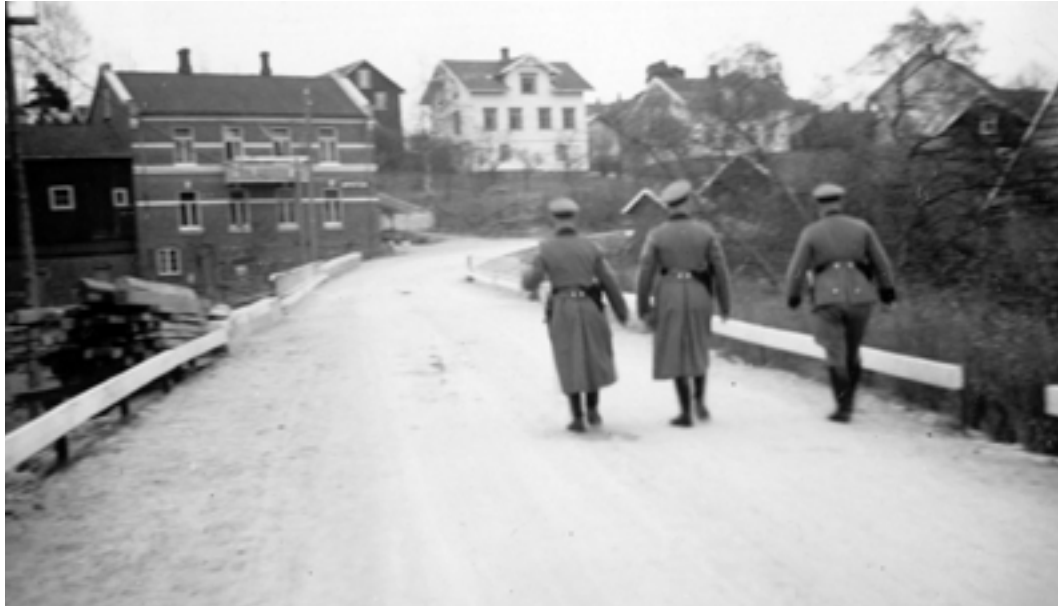
Tyske soldater i Ørje. Et vanlig syn i krigsårene.

sel forbudt over Haldenvassdraget, Store Le og andre vann i grensetraktene. Fra da av ble det ekstra farlig å krysse disse vannene.