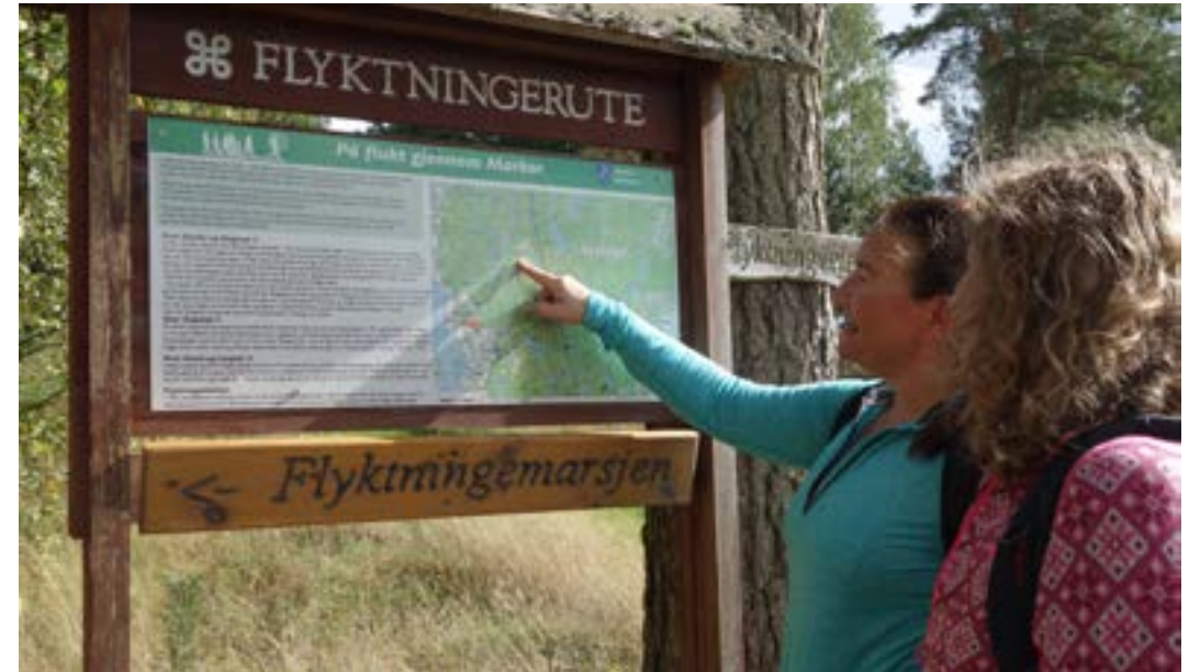
Informasjonstavle ved Skogstad gård. Fem steder i Marker er det satt opp informasjonstavler med kart og opplysninger om flyktningruter i omegnen.