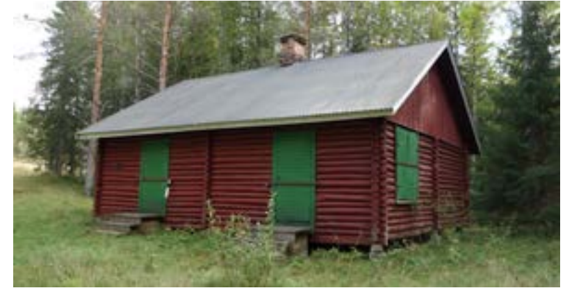
Tømmerstua på Grindforsmon var hovedkvarter/base for Timi-anruta til Milorg.

Boviken i Østervallskog, i Dalen, ved Hån, i Väng og i Böstnes. Forlegningen i Dalen lå på østsiden av Øvre Hurr. Under krigen stod det ei brakke her som ble kalt Lille Grini. Der kunne slitne flyktinger ta en hvil før de ble kjørt ned til Töcksfors. Fra disse posteringene ble flyktingene transportert ned til karantenestasjonen i Töcksfors. Der ble de registrert og sendt til badet i Töcksfors, mens klær og bagasje ble desinfisert. Så gjennomgikk de en legeundersøkelse og ble forhørt av politiet. De måtte oppgi navn og fødselsdato, yrke og hvor de kom fra og hvorfor de hadde flyktet. Så ble de sendt til hotell Sefton for overnatting. Til å begynne med ble flyktingene sendt videre til mottaksentralen i Öreryd i Småland. I juni 1942 ble mottaket flyttet til Kjesäter ved Vingåker i Sørmland. Mot slutten av krigen kunne Kjesäter huse 7-800 nyankomne flyktinger.