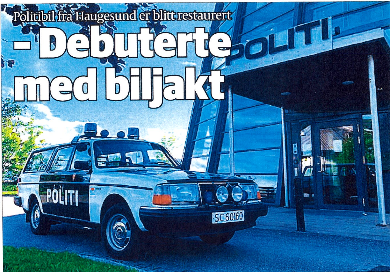
RESTAURERT: «Viggo» - en 1985-modell Volvo 240.