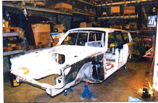
STOR JOBB: Dagnadsgjengen i Mo i Rana plukket bilen fra hverandre før de satte den sammen igjen.