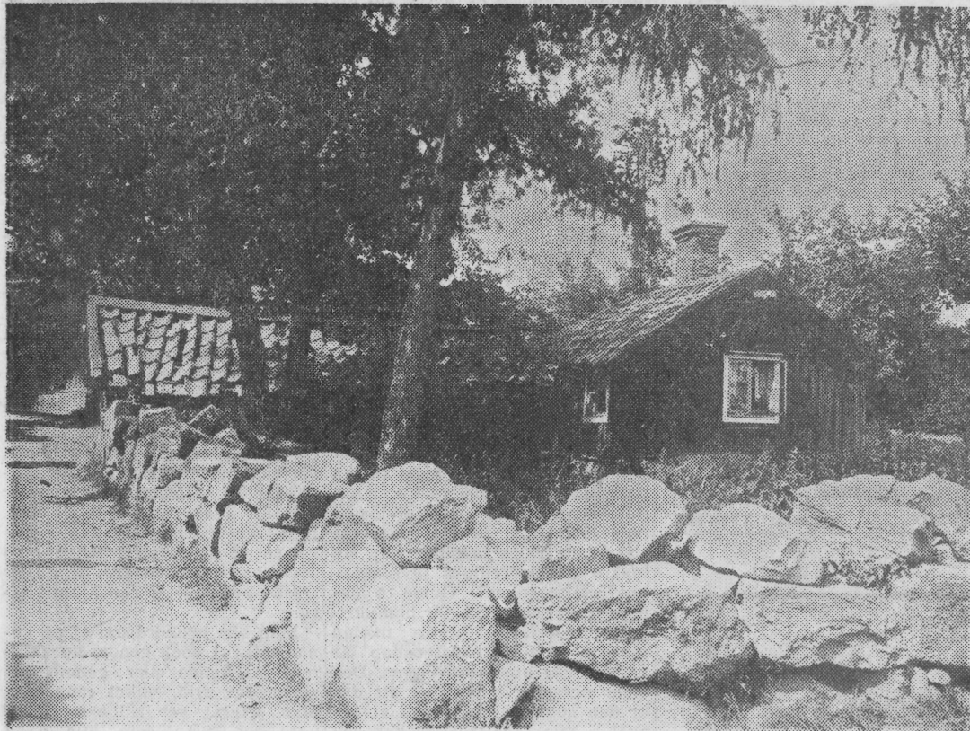
Den idylliska Flinkstugan när den stod på Kyrkbacken.