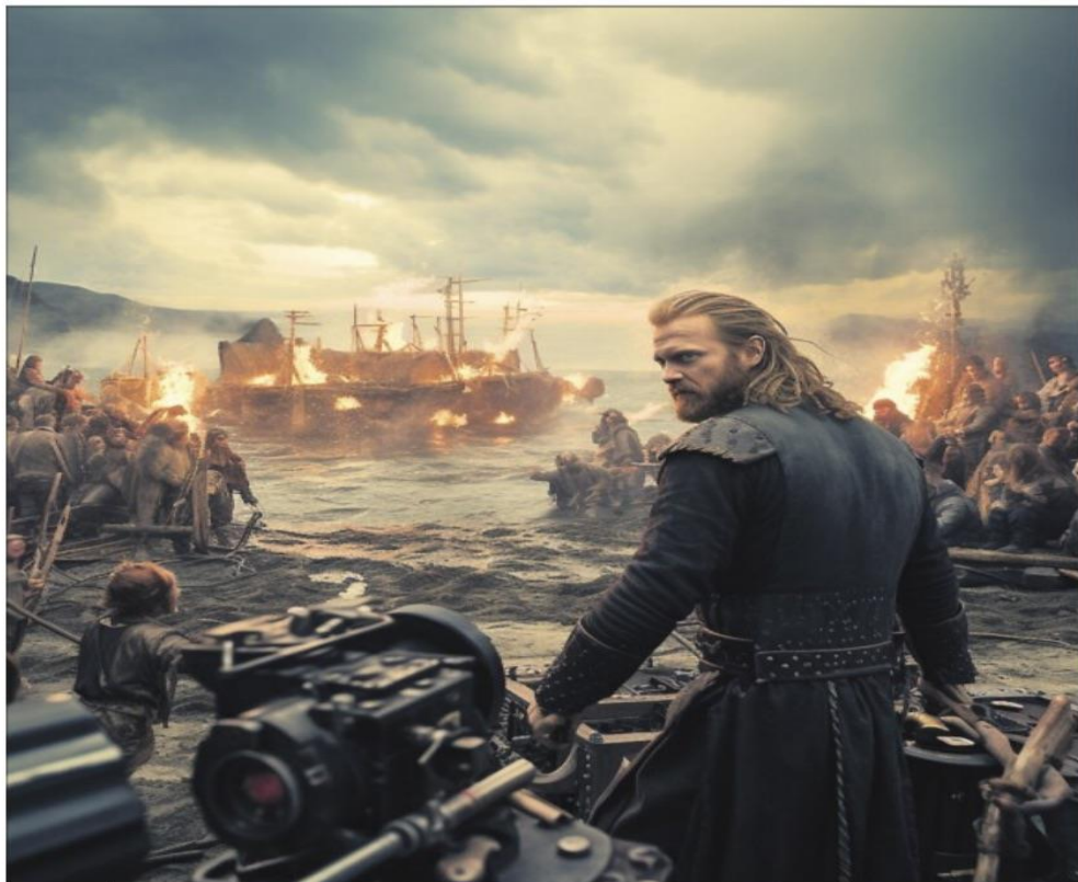
PÅ TV: Slik ser kunstig intelligens-roboten Midjourney for seg hvordan en filminnspilling av et vikingslag ser ut.

– Det handler om skurken i historien, Tore Hund. Det er en veldig interessant vinkling på en kjent hendelse, og bedre