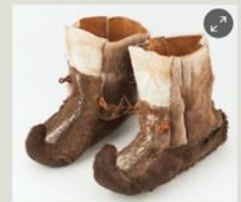
Skaller fra Kvalsund i Finnmark. Skaller ble brukt av både samer, kvener og nordmenn.