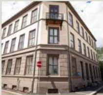
OBOS-gården Wessels gate 15

Oslo, 1865. Med 8 hjem fra 1879 til 2002.