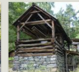
Vannkraft og smie