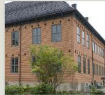
Dronningens gate 15