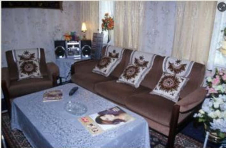
Stua i «Et pakistansk hjem i Norge – 2002» i OBOS-gården – Wessels gate 15.

Leiligheten er innredet for å vise hvordan en norsk-pakistansk familie kunne innrede hjemmet sitt i 2002.