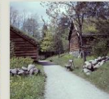
Sunnfjord og Nordfjord