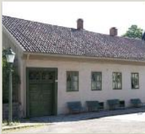
Fred. Olsens gate 13