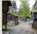
Husmannsplass fra Trøndelag