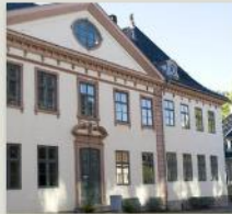
Collettgården - Kirkegata 15

Oslo, 1865. Med 8 hjem fra 1879 til 2002.