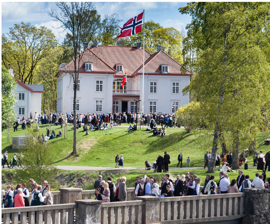
Eidsvoll 1814

Eidsvoll 1814 forvalter Norges nasjonalmonument, Eidsvollsbygningen, hvor den norske grunnloven ble debattert, skrevet og stemt over i 1814. Museet formidler hvordan den ble den viktigste byggestein for utviklingen av det norske demokratiet og det moderne Norge. Museet har i tillegg en særskilt oppgave for demokratilæring overfor barn og unge. Det vil være hovedfokuset i det nye publikumstilbudet som åpner i demokratisenteret Wergelands Hus i 2024.