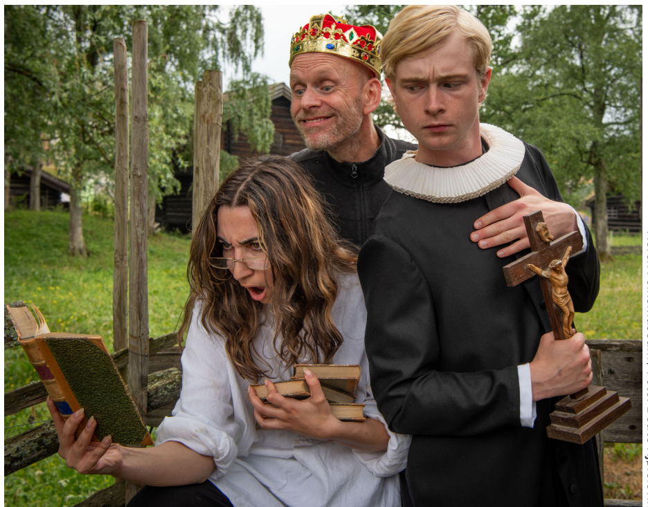
Norsk Folkemuseum / Foto: Beate Kjørslevik

-Sette av tid til evaluering og prioritere videreutvikling.