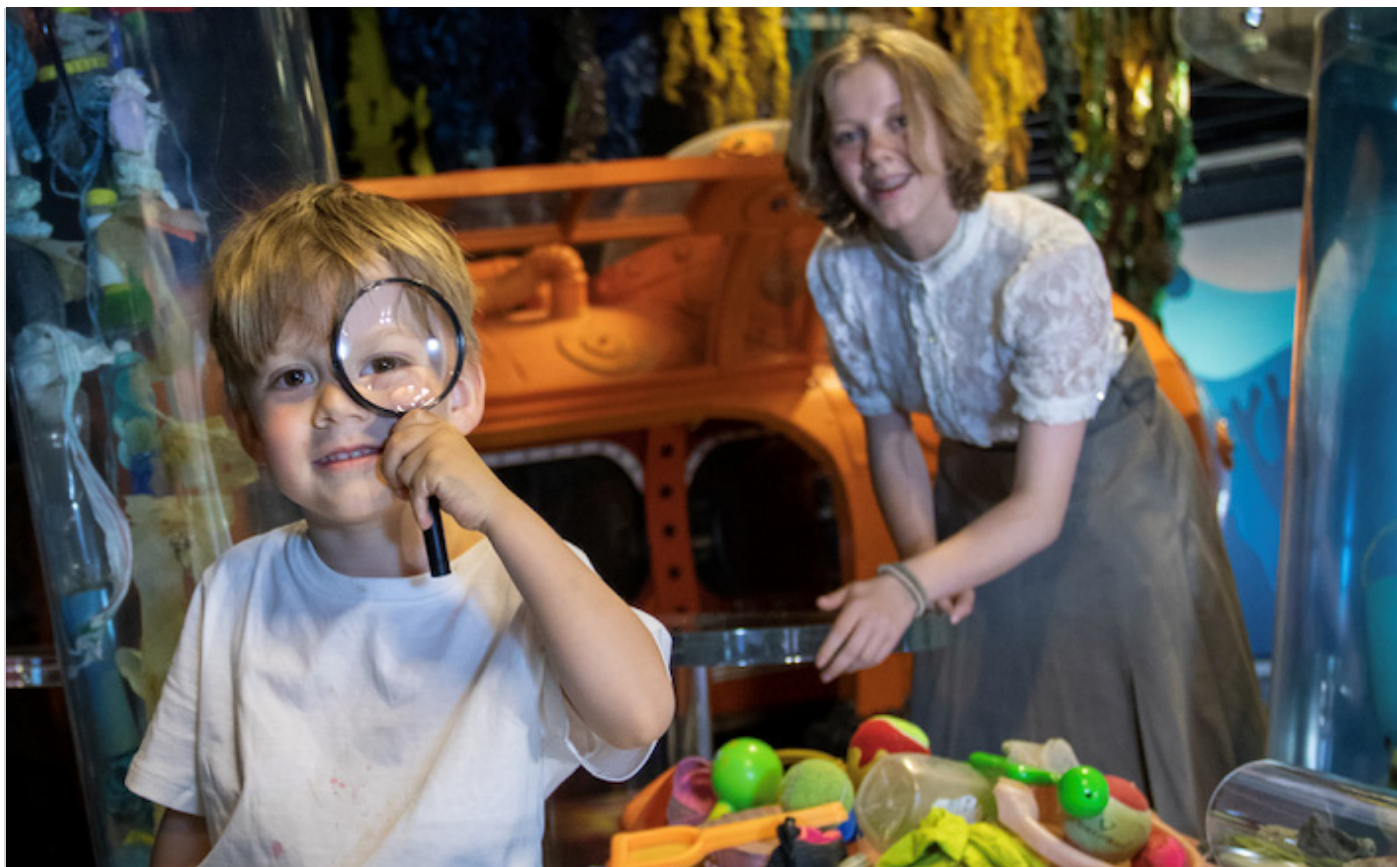
Norsk Maritimt Museum / Foto: WAL