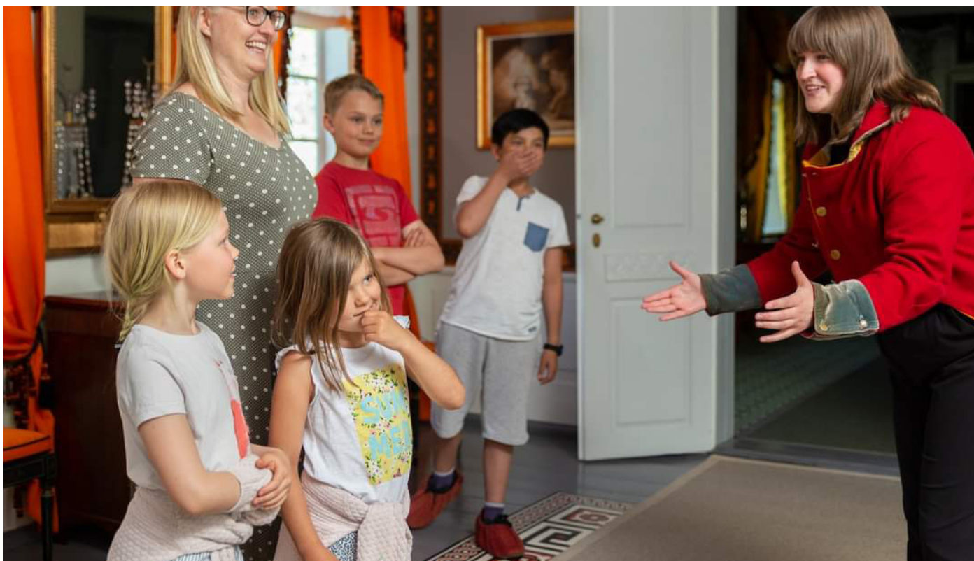
Eidsvoll 1814

Stiftelsen Norsk Folkemuseum er en gruppe museer og attraksjoner i Oslo-området fordelt på seks arenaer: Bogstad Gård, Bygdø Kongsgård, Eidsvoll 1814, IBSEN Museum & Teater, Norsk Folkemuseum og Norsk Maritimt Museum. Til sammen forvalter arenaene en stor samling kulturhistoriske gjenstander, bygninger, dokumentasjon og forskningsmateriale.