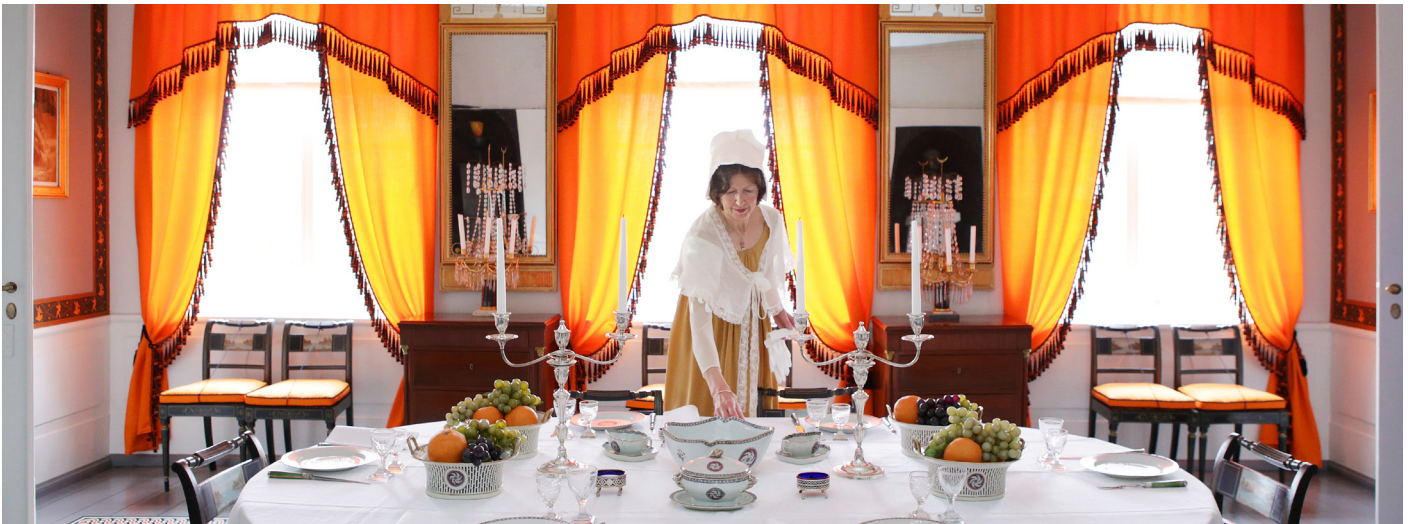
Eidsvoll 1814

I vid forstand kan man si at det meste av stiftelsens virksomhet er formidling, ettersom det påvirker publikums opplevelser av de ulike arenaene. Alle som arbeider i Stiftelsen Norsk Folkemuseum bidrar til gode besøksopplevelser på ulike måter.