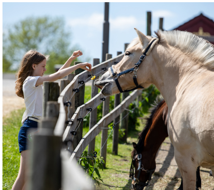
Bygdø Kongsgård