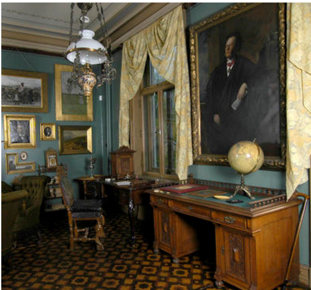
IBSEN Museum & Teater