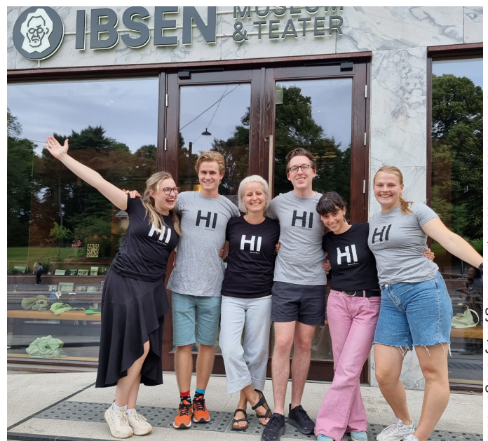
IBSEN Museum &amp; Teater