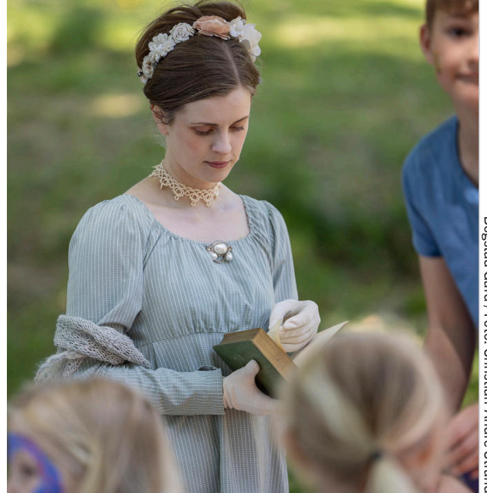
Bogstad Gård