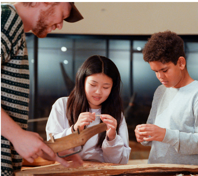
Norsk Maritimt Museum / Foto: Metro Branding

Stiftelsen Norsk Folkemuseum driver utleie av seminar og -selskapslokaler på flere arenaer. Disse leietakerne skal alltid få tilbud om omvisning eller annen type formidling.