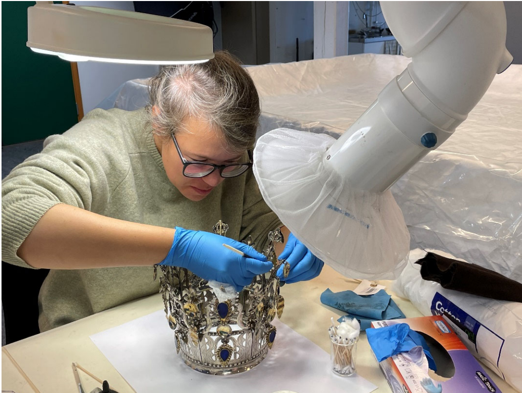
Reingjering av brurekrone før utstilling.