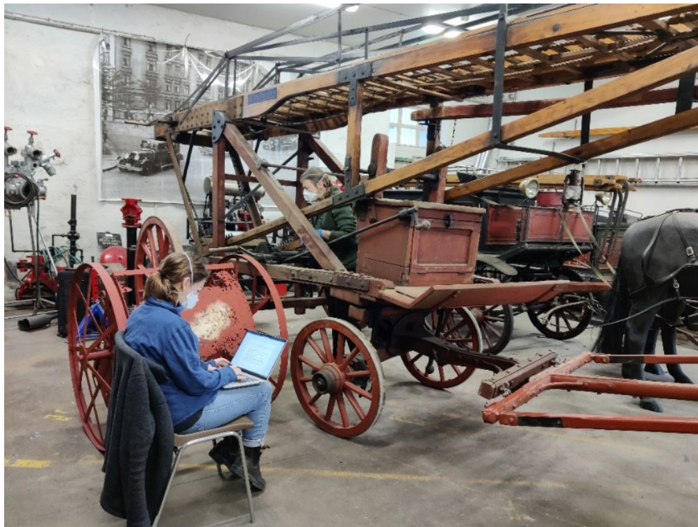
Vurdering av brannvogner

I mai vurderte gjenstandskonservatorane tilstanden til fleire brannvogner ved den gamle hovudbrannstasjonen. Synfaringa resulterer i ein tilstandsrapport som også gir tilrådingar om bevaring av vognene.