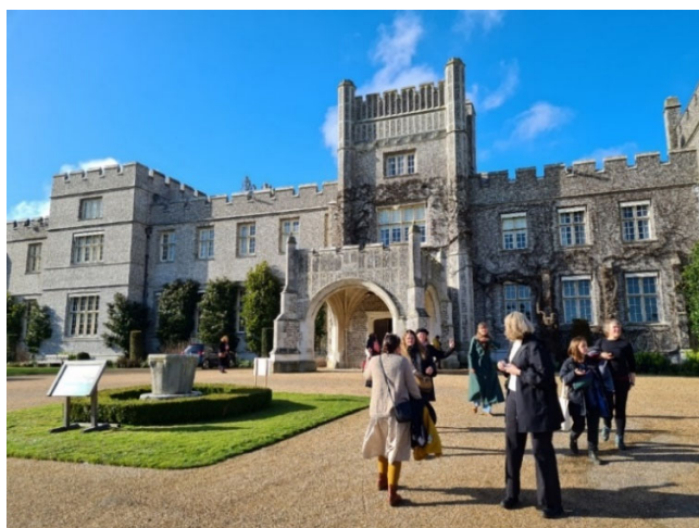
Bevaringstenestene på West Dean College

Vi deltok på felles personaltur til Winchester, og hadde fine dagar der i lag med resten av MUHO. Bevaringstenestene besøkte også West Dean College som blant anna tilbyr kurs innan ulike konserveringsfelt.