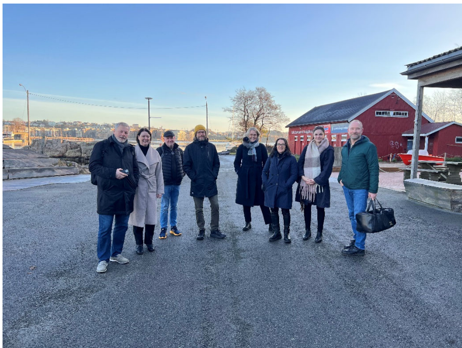
Studietur til Vest-Agder-Museet sitt nye magasin

Vi har venta på at fylkeskommunen skulle fremje ei politisk sak om eigarskap og byggansvar for det nye samlingsentrumet. Etersom dette let vente på seg, søkte vi om 300 000 kr frå Museumsloft 2023 for å finansiere naudsynt innleigd kompetanse for å få undersøkt grunnforholda for ei aktuell tomt på Haukås. Målet var å få kartlagt om tomta er eigna til å magasinere varme og kulde for å klimaregulere bygga og få teikna ei skisse til bygg på tomta. Søknaden vart avslått.