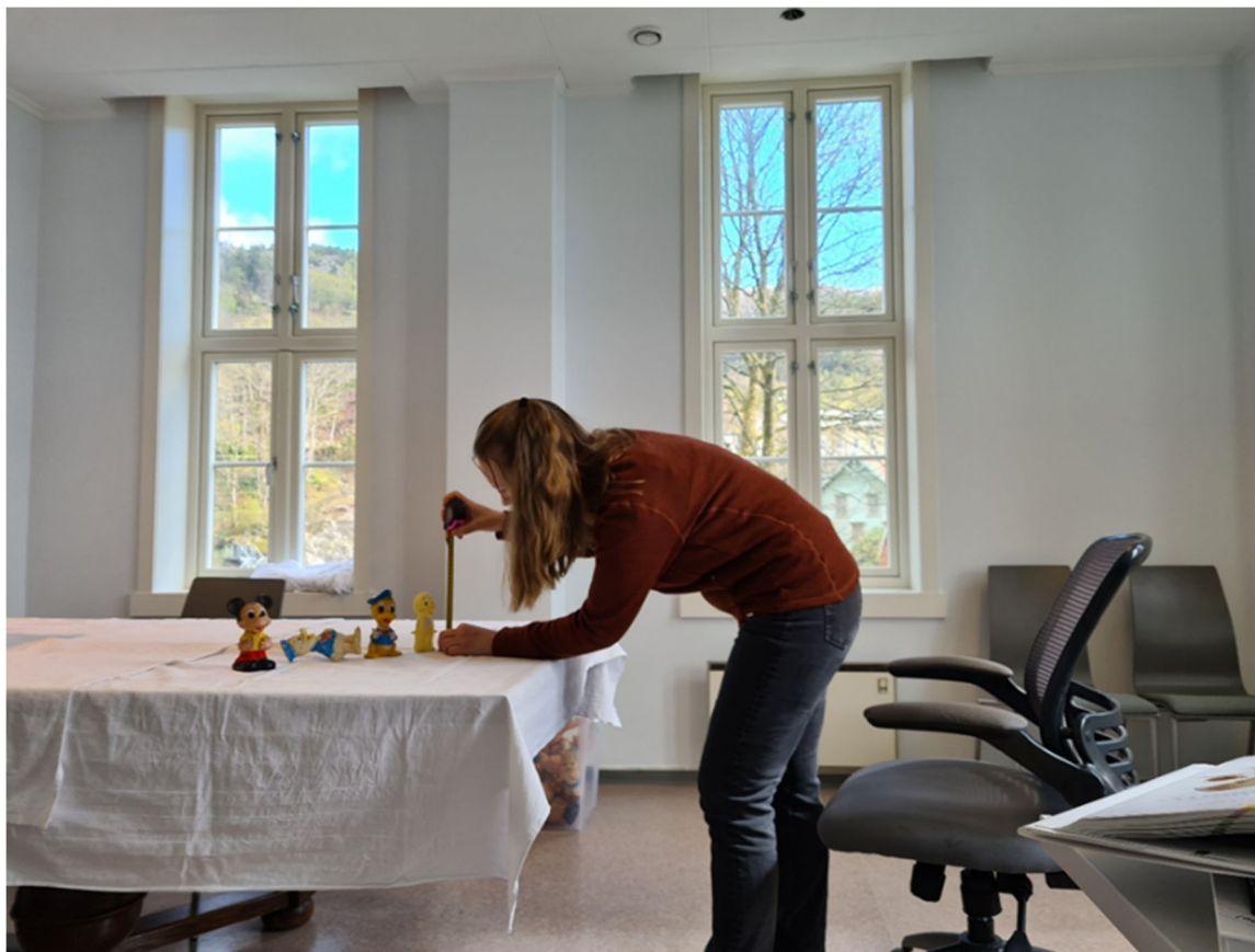
Oppmåling av leiketøy frå Gamle Bergen sine samlingar

Dokumentasjonsteam er med på Tradisjonsbåtprosjektet på tvers av musea i Noreg, leidd av Norsk Maritimt Museum med støtte frå Kulturdirektoratet, med mål om å finna standardisert måte å registrera tradisjonsbåtar, og dessutan bruka felles nomenklatur i KulturNav.