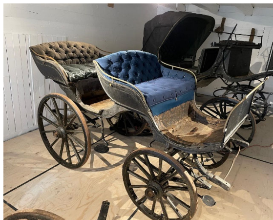
Etter konservering (fase 1)