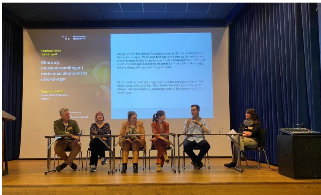
Paneldebatt med deltakarar frå Nederland, Storbritannia, Belgia og Norge.

På dag to fekk vi høyre om fleire innklimaprojekt, både i magasin og i kulturhistoriske bygningar frå norske deltakar. Det vart diskutert korleis ein kan sette i verk relativt enkle tiltak som kan vere kostnadssparande på lang sikt, og vi fekk høyre om nye magasinprosjekt frå fleire delar av landet. På dette området er det viktig å hente erfaringar frå kvarandre.