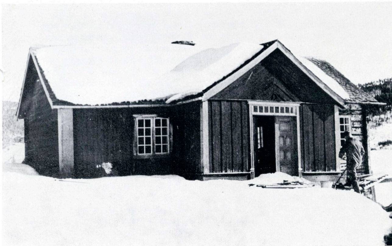
Stua frå Moahaugen i Øystre Slidre. Eksterior under rivinga.