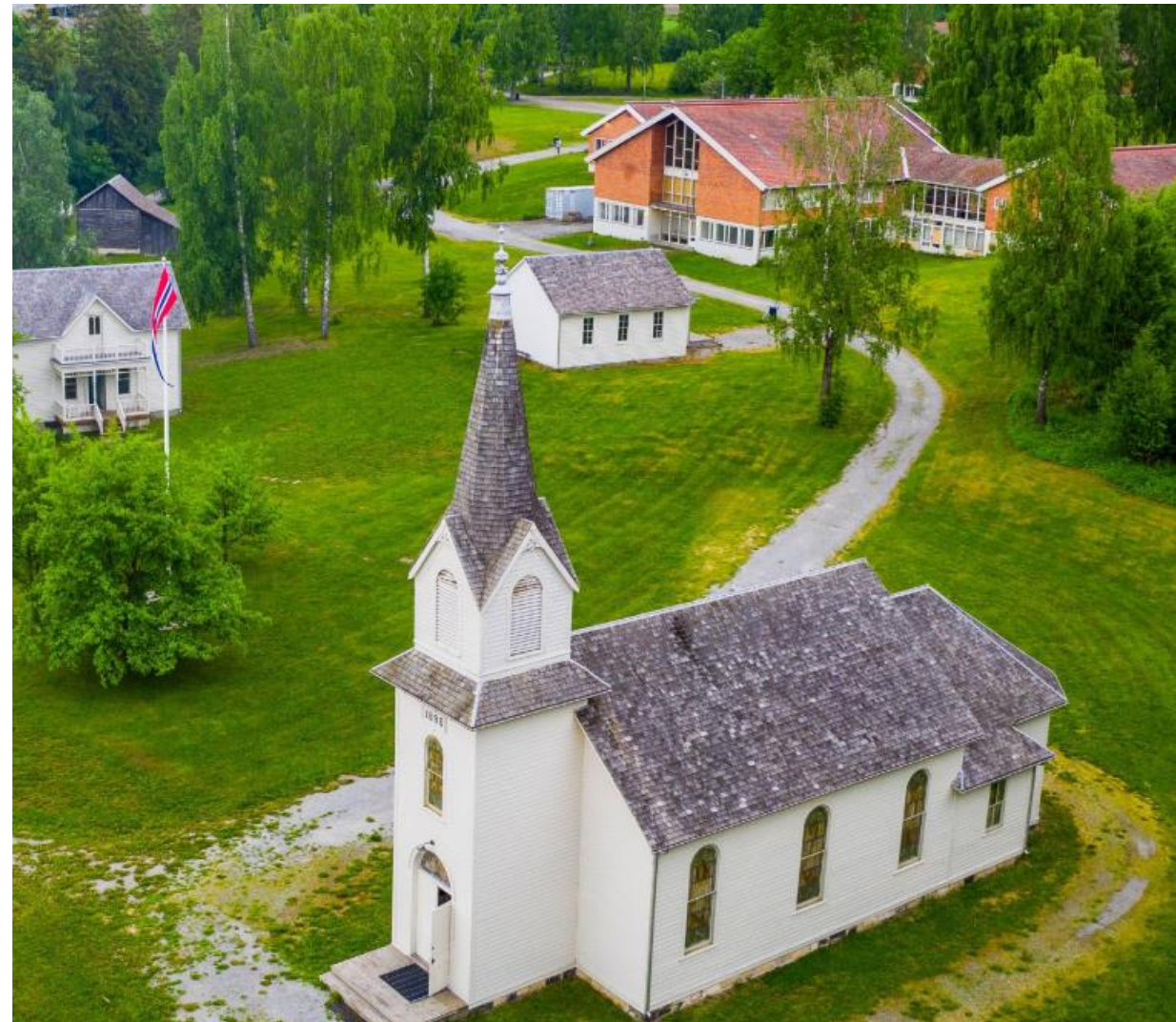
"Oak Ridge Lutheran Church», flyttet fra utkanten av Houston, Minnesota. Utvandrerkirken.