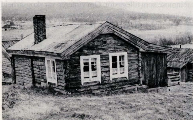
Stua slik den står i 1988. På framsida påbygget som ble bygd i 1947.

Vi hadde det vi trengte, og vi hadde det pent og trivelig sjøl om det var enkelt. Vi pyntet med duk på stuebordet, og på senga hadde vi et kvitt heklateppe. Det var kvite bomullsgardiner foran vinduene, fortrekksgardiner sydde jeg av kveitmjølsekker. Mjølsekker brukte vi nå forresten til klær og duker óg. Noen lagde gardiner av kreppapir, med fine tunger i nerkanten. Jeg kan nå huske at noen ikke hadde gardiner i det hele tatt; det hadde ikke blitt vanlig. Og så hadde vi blomster i vinduskarmen, geranier, hortensia, fuksia, tøffel.... det var visst de alminneligste. Ute var det lite blomster, men vinduene var fulle. Vi plantet dem i fiskebollbokser som vi kledde med kreppapir. Ellers var det vel ikke så mye pynt; Jeg tror knapt vi hadde bilder på veggene. Vi hadde pyntehåndkle over kjøkkenbenken. Det var der vi vasket kopper, og der vasket vi oss sjøl, óg. Veggene var malt - kjøkkenet var grønt og stua blå. Golvene ble malt med brun golvmaling om sommeren, og da lå vi på buret mens malinga tørket, og så la vi på