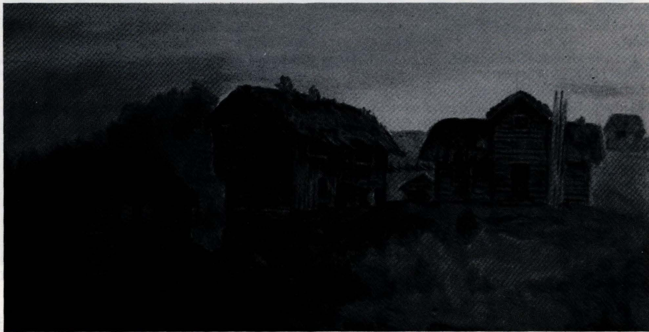
Gammel akvarell som viser tre hus som sto på Grindflekken. Fra venstre: Låvebygning, loftsbygning og barfrøstue. Bildet henger på Bull-museet, ukjent kunstner.

3¼ M. bred. Denne Bygning, der har en Murpibe, opført fra Grunden af, 5 Fag Vinduer og 2 Døre, samt Tag af Bord, Næver og Jord, takstsattes for 700 Kr En 2 Etages Kakkellovn i denne Bygning takstsattes for 20 720,00».