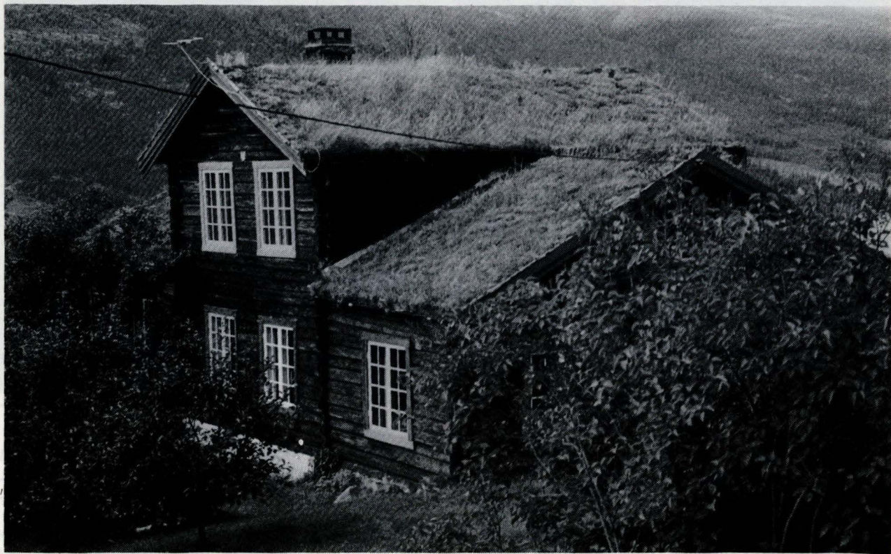
«En enetages Hovedbygning, hvis Røst dog er gjenembrudt ved en Opbygning fra dens Midte».

1. En enetages Hovedbygning, hvis Røst dog er gjenembrudt ved en Opbygning fra dens Midte, opført af Tømer og Bord, 16 m. lang, 8 m. bred og 5 m. høi, til underste Røst, Opbygningen gaar over Bygningens Bredde og hæver sig 1½ M over det indre Røst i en Længde af 6 M. Bygningen, der er opført paa en 1½ M tyk og gennemsnitlig 1½ M høi Graastensmur, har 2de Kjældere i denne, 2 Skortenspiber, den ene opført fra Grunden af og den anden fra Ramen, Tag af Træstikker med Undertag af Næver, Jord og Lækter, 16