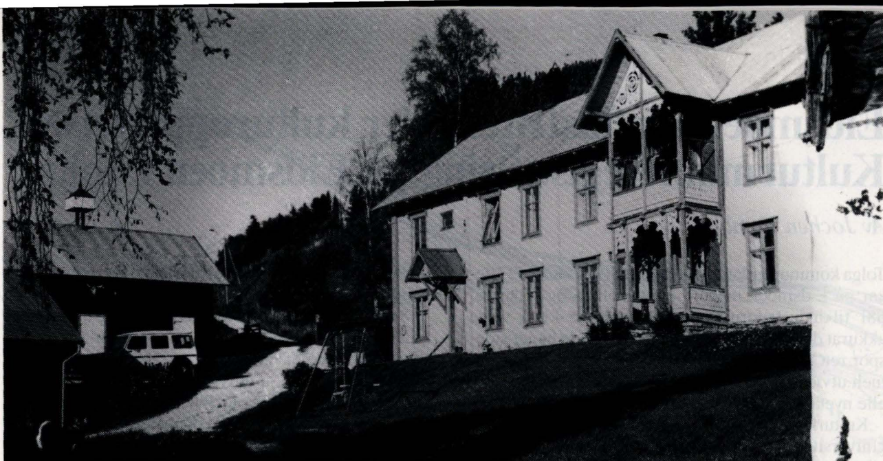
Tunet på Grindflekken sett fra sør. I bakgrunnen uthuset som blant annet inneholder to gamle stabbur. Til høyre hovedbygningen fra 1900. Til høyre for og parallelt med denne bygningen går nyeveien. Der sto stabbura før de ble flyttet. Den gamle veien gikk gjennom tunet. Foto: Musea i Nord-Østerdalen, Amund Spangen, 1989.

i brukbar Stand, takstsattes for 300,00 Tilsammen Kr. 16000,00 skriver seksten Tusinde Kroner.