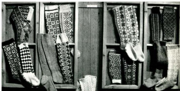
"Hussur og bussulegger", fra strikkentstillinga på Museumssenteret Ramsmoen.