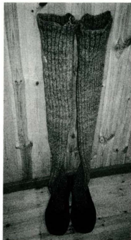
Foto viser køyresko frå Tyll-dalen. (73404)

Køyreskoene, som vist på bildet, var tidlegare tiders støvletter. Her er skaffet strikka av ullgarn som er spunne saman med geitragg eller kutagl, og sjøve foten er av lær. Grunnen til denne kombinasjonen kan vera å drøye bruken av dyre materialer, slik som lær. Dette var eit skotøy som kvinnene brukte når dei var ute og kørde med hest.