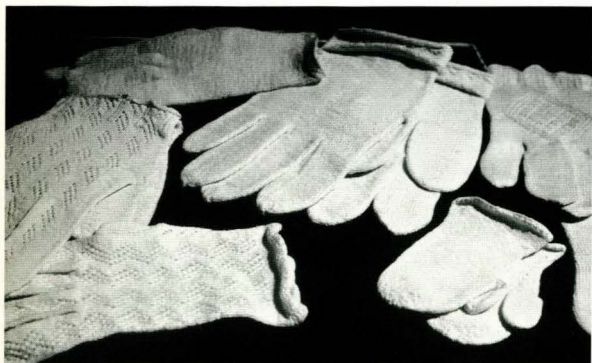
Brud- og brudgomsvotter frå Folldalen og Vingelen. (21959)

Å strikke mønster i ei farge, med vrang og rette masker, to masker saman og med kast på pinnen som ga hol, er den eldste teknikken innan mønsterstrikking. Strikkevarer innført frå utlandet på 1600 og 1700-talet var «mønstra» på denne måten. Desse vart eit forbilete for den folkelege strikkekunsten.