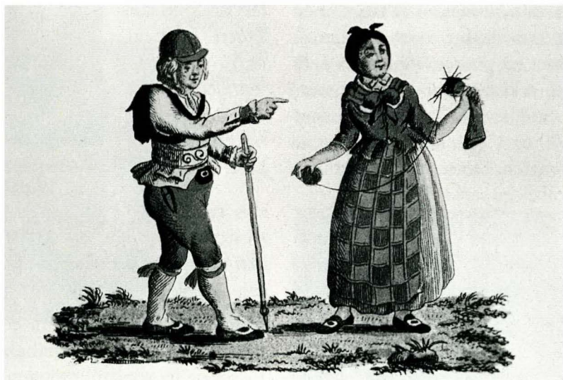
«Folldøler», teikna ca 1796-97 av Johan F. L. Dreier.

På etterjuls vinteren 1999 presenterte Museumssenteret utstillinga «Strikking og strikkekunst», om strikke tradisjoner ført framover til idag. Utstillinga kom i stand som eit samarbeid mellom Nettverksgruppa i kunst- og håndverksfag i grunnskolen i Tynset, bondekvinnelaga og Museumssenteret Ramsmoen. Bondekvinnelaga hjalp til med å samle inn gjenstander frå private, og elevene i barneskulen fekk i oppgave å finne gamle strikke-gjenstander heime. I tillegg fekk dei og sjå sine egne produkt på utstilling.