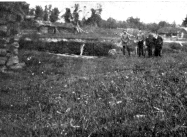
Tylldalshølen i Kora, Bjørkhølen, Haukvarpet.

ser og ein bever. På to hestar skulle han frakte heimatt 120 kg sik og ein bever. Det var bra fangst, det.