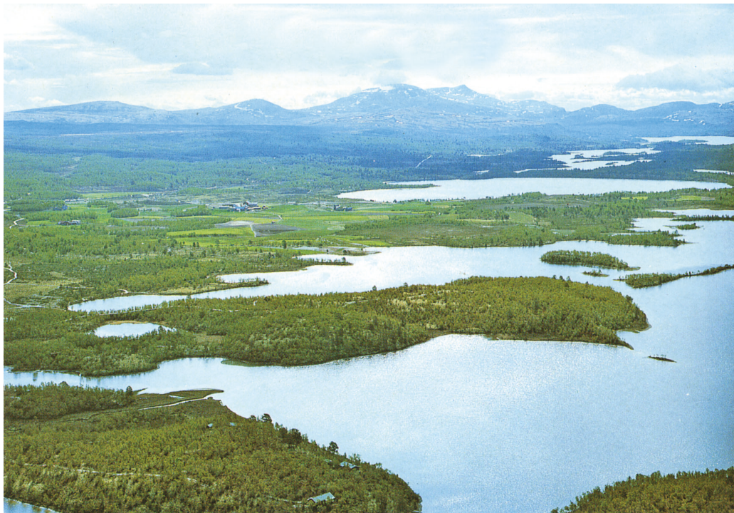
Øst over var det mange og fiskerike sjøer, som her fra Hodalen.

Bygdefolk fêr vidt og legg etter seg namn