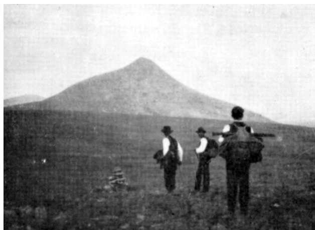
"Tylldals gamle fiskevei" til Langsjøen og Kora. Elpiggen i bakgrunnen.

Namn med Tynset i, finn vi mange stader. Fjellet nord for Sålåkinna heiter Tynsethøgda . Frå kvolvat mellom Sålåkinna og Tynsethøgda rinn Tynsetbekken som rinn ut i Halleråa som rinn ut