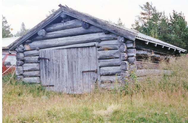
Nøster ved Kora i Tufsinga, foto Trygve Nessel.

I 1723 vart fisket i Tufsinga skyldsett til 1 hud (12 skinn). Samtidig vart fisket i Kora skyldsett til 2 skinn.