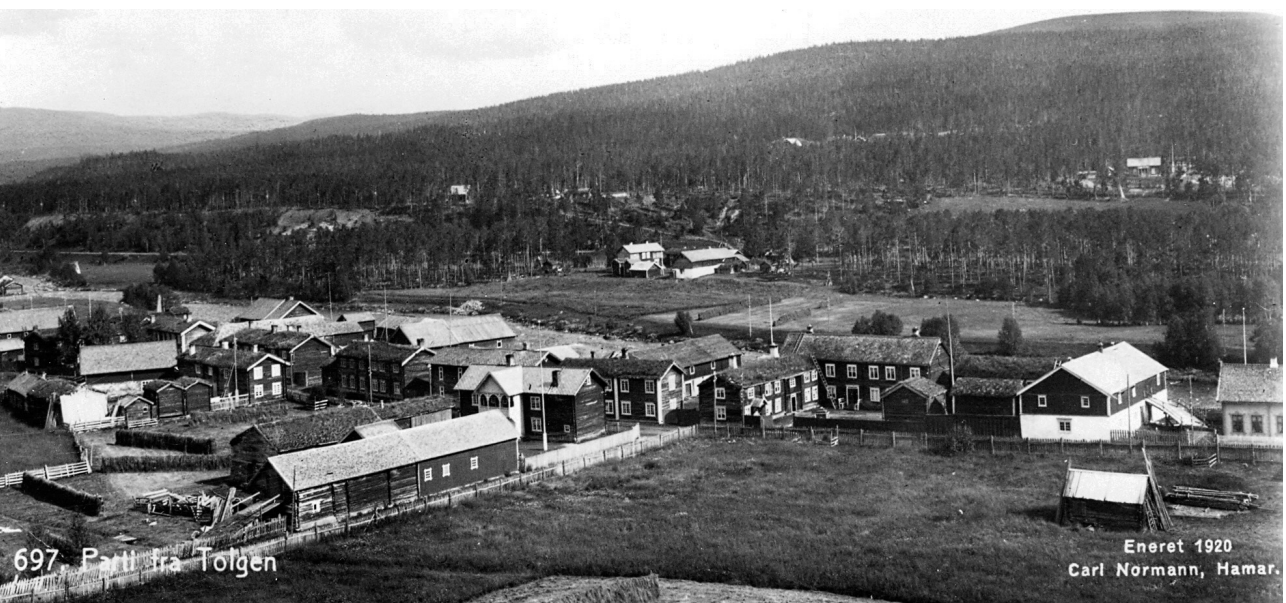
Parti fra Gata, 1920. Floorgarden midt på bidet.

"Bakkan! Navnet funkler vel ikke for mengden, men for oss det har en egen klang Det var så meget godt i den grenden som kun er et minne uten sang Det levet vi i nøisomhet og gammen Søsken og foreldre sammen Kirka står der så høgreist og stor Utenfor veggen sover nu far og mor."