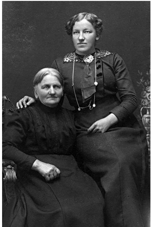
Mor og jeg.