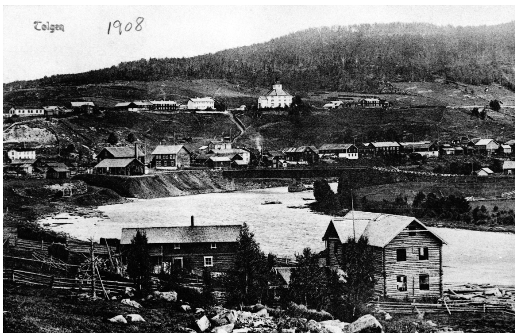
Olavas "verden", kirka med Bakkom, langs Glåma Gata.