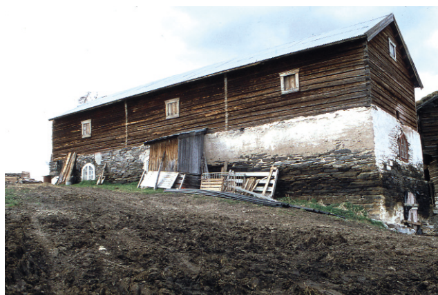
Utistuen, Vingelsåsen ca. 1980.

Tynset: På Tynset er det mange steinfjøs, flere brukes, det gjelder Røsten Brydalslia (ca 1840), Kalbækken, Mælan, Storeng, der er det også ei masstu i stein, begge med kleberstein med