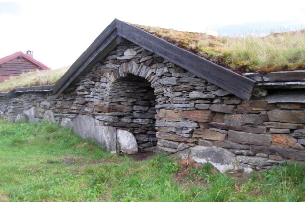
Evensmovangen, Magnillsjøan, 1844.

initialer, Lian, denne garden ligger i svært hellende terreng slik at stor del av møkk-kjelleren vises, slik er det også i Nordistuen og Utbyhaugen, oppe i bygda. På Lian har vi også et fint eksempel på imponerende grunnmur og kjeller under det gamle våningshuset. På Lunstøeng, Tverråvängen, Røsten i Kjæreng, Sageng, Tangen (Neby) Bortistuen Neby, Holemoen og Ramsmoen er det fjøs som ikke lenger brukes. Steinfjøset på Ramsmoen fra etter 1877 brukes til utstillingslokale. Slik er det også med restene etter steinfjøset på Vollan. Fjøset som står i dag er bare en mindre del. Bygget var nærmest uformet, med to fjøs ved sida av hverandre mot et tverrgående bygg. Her var det lågt høytrev til å begynne med, dette ble gjort høgere i 1920 åra, men er nå tilbake i den gamle formen. Av andre fjøs på Kvikne er fjøset i Grøtli imponerende. Plassert som det er i den bratte bakken får det stor høyde fra møkk-kjelleren til mønet.