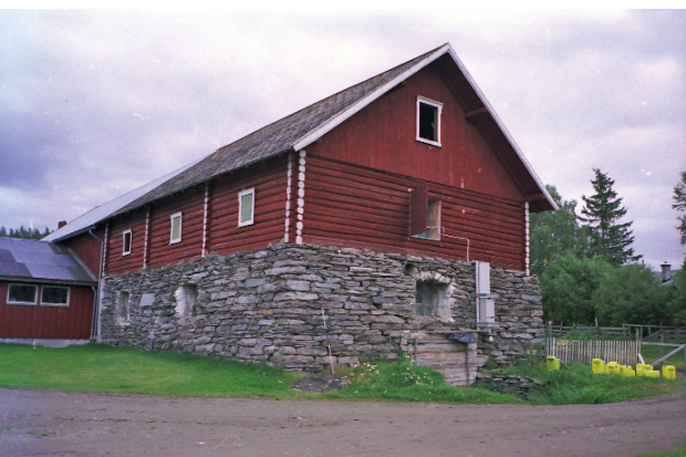
Rørsten, Brydalslia, Tynset.