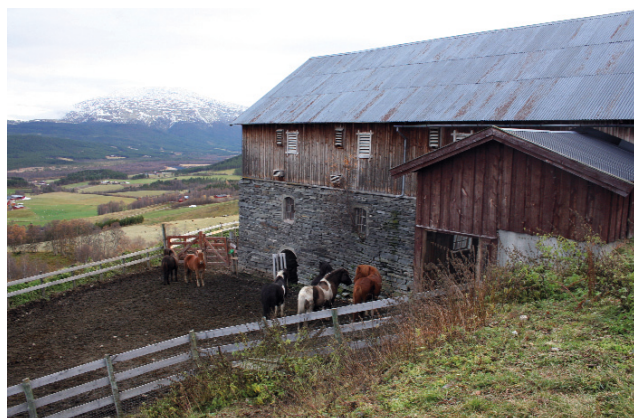
Lian, Fåset, Tynset.