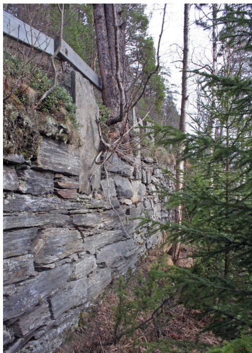
Steinmuring, gammelvegen Kvikne.

På den gamle hovedvegen over Kvikne var det også nødvendig med steinmuring, særlig på partiet mot Nåver-