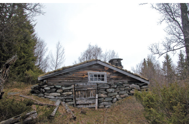
Smie, Bredalslia, Os.