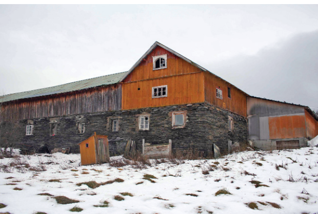
Røsten, Kjæring, Tynset