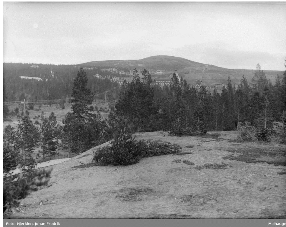
Folldal ca. 1900