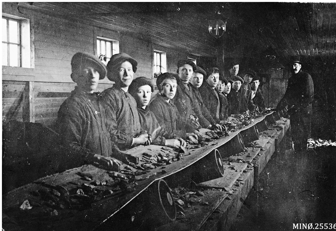
I «plukketuset» arbeidet mindreårige med å sortere mineral fra gråmasse. Foto fra 1912: Musea i Nord-Østerdalen