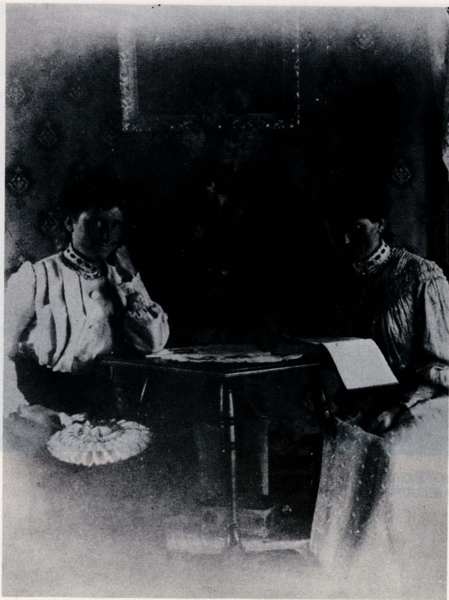
Filosofen Julie og litteraten Julie.