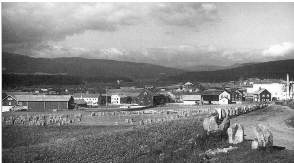
Steigjelen og Storsteigen 1920. Slik såg Storsteigen ut det året Kjell Aukrust vart født. Biletet er teke der Aukrustmonumentet står i dag.