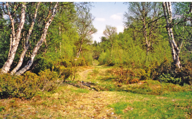
Omlag slik såg vel vegen oppover Nørdalen ut i 1788 òg.

Det er over fem mil frå Dalsbygda til fiskeplassane i Tufsinga. Dalsbygdingane fór nok den gamle kjerkvegen til Os. Før det vart bru over Glåma i Os, var det sundstad ved garden Sundet med båtfrakt over elva. Dei fann tomta etter naustet rundt år 1900. Elles var det vel vad; der kunne både folk og dyr koma over. Både garden Volden og Narjordet var tidlegare setrar under Os-garden med gammal seterveg. Vi må vel da rekne med at dei fór over Nøra oppover der det no er natursti. På skilt nr. 18 ved Storhåen står det at denne ferdselsleia var frå 1660 til 1820 kløvvegen til grenda Narjordet, Narbu-voll, Øversjødalen, Tufsingdalen og vidare utover.