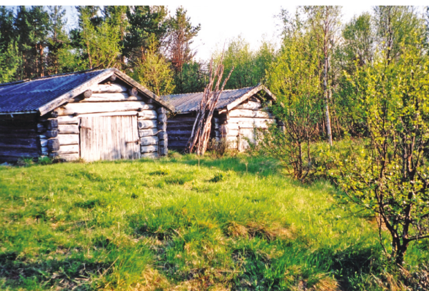
Tufsingdølane har båtนาusta sine ved Strømmen. I buer i dette området budde vel fiskarane frå Dalsbygda og Os i 1788.

fastsett dato ved hølen nedafor Korstrømmen. Kanskje det var her dei heldt til. No har tufsingdølane fleire naust og bu her. Det går elles sagn om at tylldølan heldt til ved garden Sæter og hadde familie med og derfor kalla stellet Sæter 2 . Datoen for fiskestart var 11. september. (Forlik 1704). Vi må vel rekne med at dei fiska, kanskje i lag på fire, og at dei fordelte fiskeplassane etter eit slags system. I seinare tid er det rekna med 15 notvarp ned til Rendalsbua og 5 derifrå og ut i Femunden. Nokre av fiskarane hadde slektingar i Tufsingdalen. Kanskje dei budde der og hadde samarbeid med slektingane. Tufsingdølane hadde vel frå første tid drive eit eller anna slags fiske i Tufsinga.