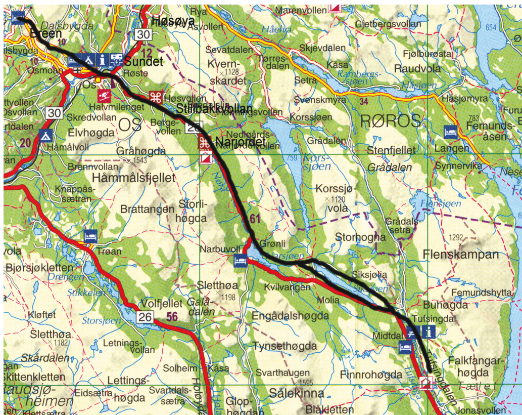
Fiskevegen frå Dalsbygda til Tufsingdalen.

Dei hadde vel buer ved elva frå gammalt av og båtar. Dei skulle møte til