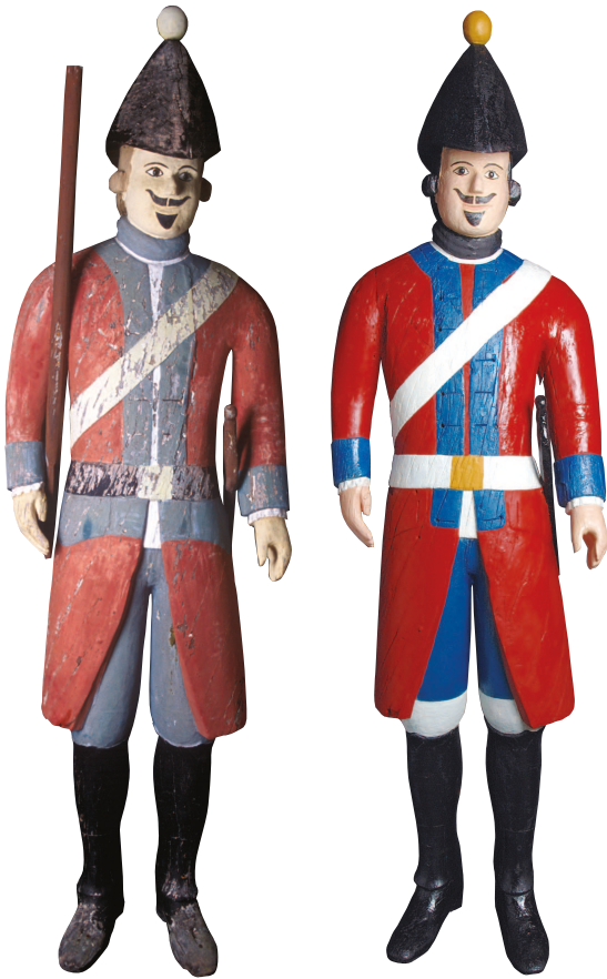
Soldat fra 1770, før og etter restaureringer.

Hårpryd: Soldatens hår måtte være så langt at det kunne krølles i to sidebukler. Håret i bakhodet bandt man sammen omkring en ståltråd til en hårpisk som var 30 cm lang. Avskaffet 1803. Rød kjole med lange skjøter, blå rabatter, krage og oppslag. Tinnkapper. Bukse og vest skulle ha samme farge som rabattene, ved vervede regimenter før 1770. Hatten skulle være trekantet, tosnutet hatt ble båret av offiserer etter 1790. Støvlettene er de svarte gamasjer og det hvite er antage-