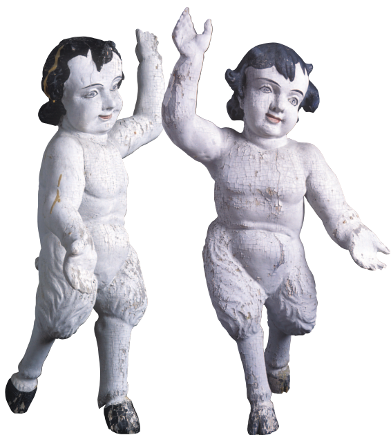
Satyrer, før restaurering.