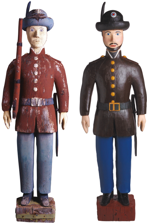
Soldat fra Østerdalske Jægercorps, før og etter restaurering.