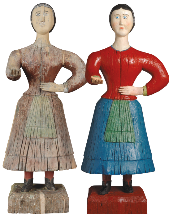
Putt-Anne fra Os, før og etter restaurering.