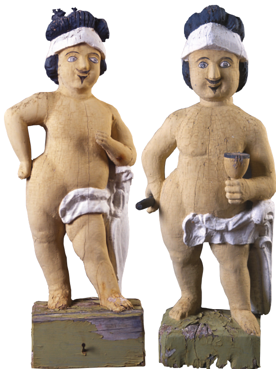
Marsfigurer, før restaurering.