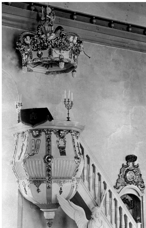
Jøns Ljungbergs prekestol i Wemdalen kirke 1790.

kirke, den er fra 1763, og for prekestolen i Hede kirke fra 1790. Det var mange oppdrag for en treskjærer i Trondheim og Røros på slutten av 1700-tallet, det var de store trepaléenes tid.