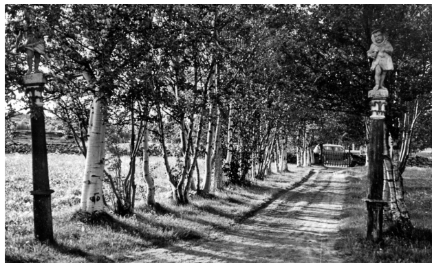
To av de fire årstider, "vinter" og "vår" sees her på opprinnelige søyler i Engan. "Vinter" med teppe, kvinnelig "vår" med blomster