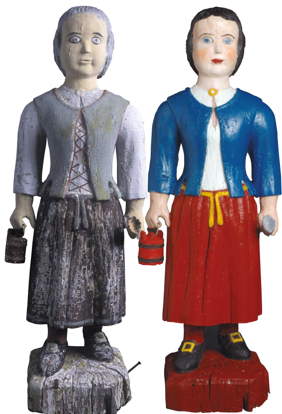
Budeie, før og etter restaurering.

Serken/skjorta har halsringing uten linning, noe som går godt inn i tidsbildet. Serken går over halsringinga på trøya, helt rundt. Under serkringen/spretta (halsnåla) er en halssplitt.