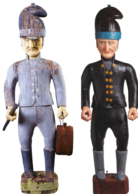
Jens oppi Stenom, før og etter restaurering.