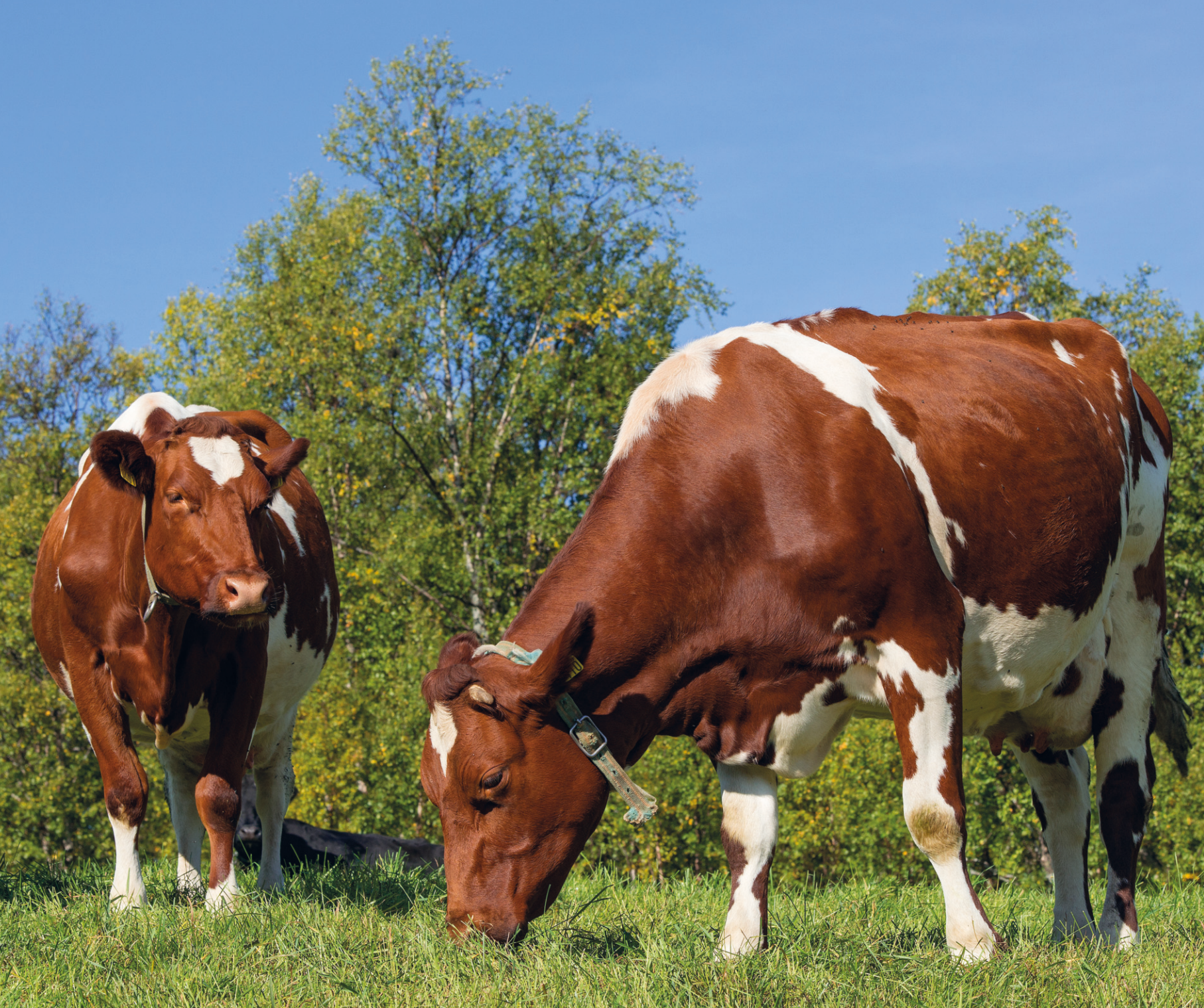
NRF-kyr på beite en septemberdag i 2015.