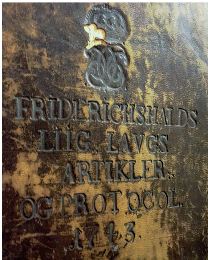
Fredrikshald Liig Laug.