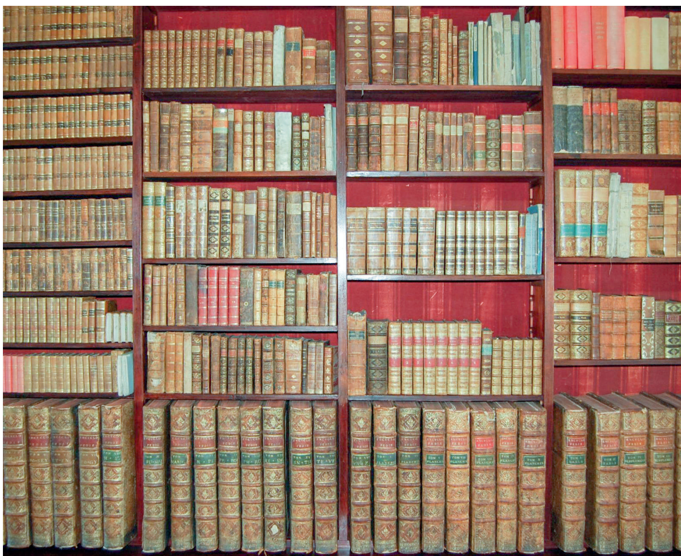
Bøkene i biblioteket på Rød samlet av husets kvinner og menn.