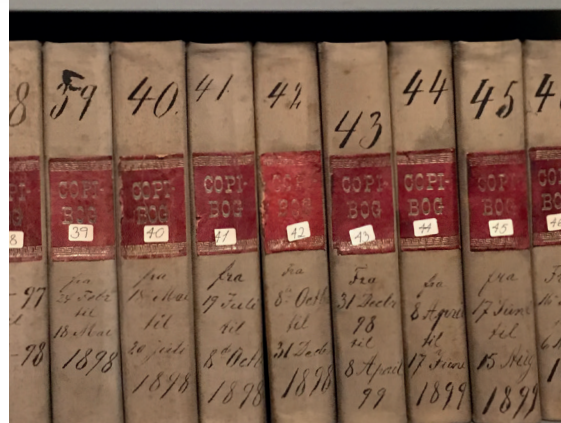
Fra Moss Glassverks arkiv. Foto: Trond Svandal