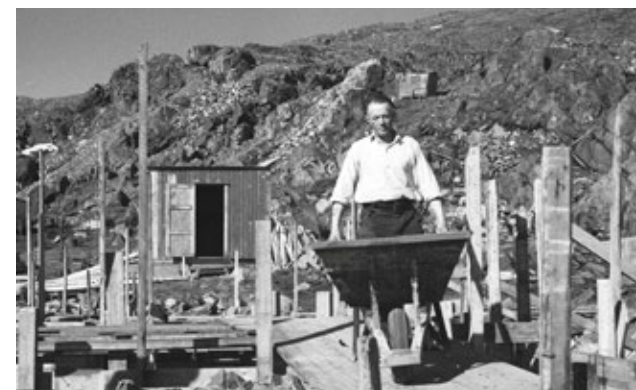
Begge foto: Bolighus bygges i Honningsvåg 1946/47.