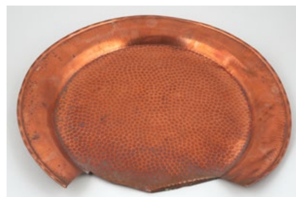
Kobberfatet til familien Persen ble til fiskekroker etter 2. verdenskrig.