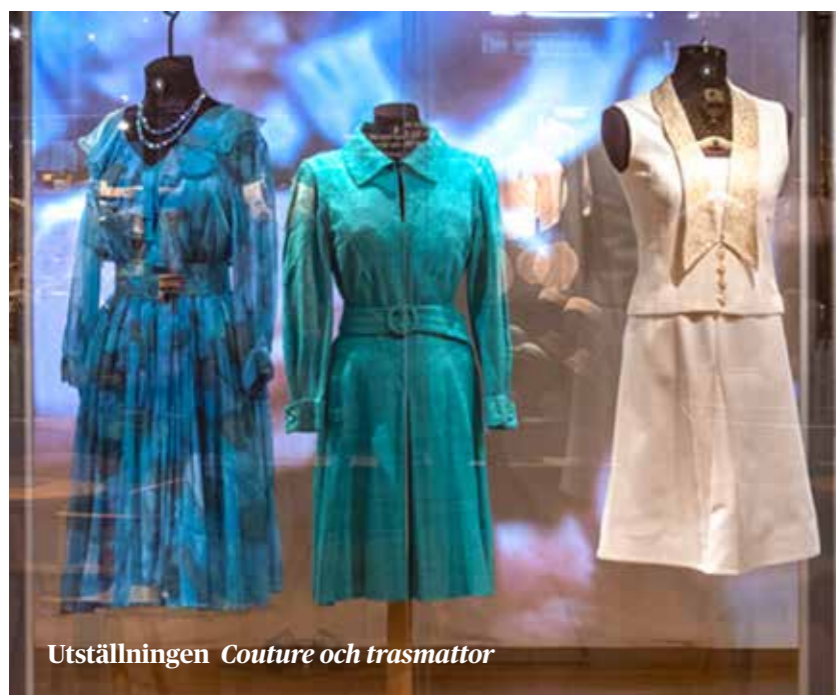
Utställningen Couture och trasmattor