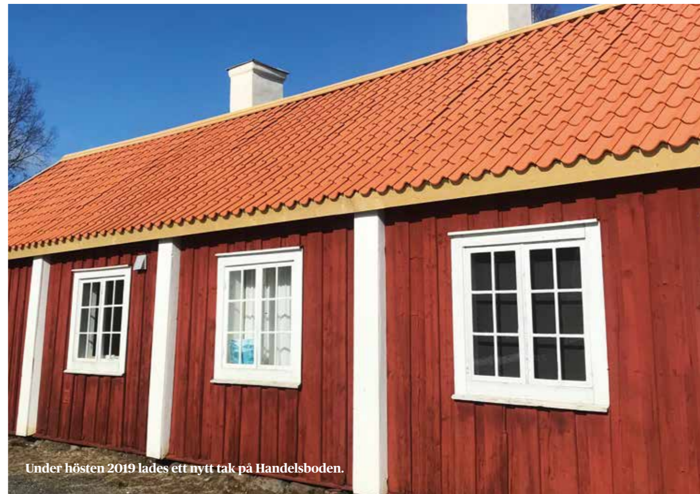
Under hösten 2019 lades ett nytt tak på Handelsboden.

Prioriteringarna och förändringarna kommer att påverka hela verksamheten, och beskrivs också till viss del i verksamhetsberättelsen nedan. Museet är i början av denna förändringsprocess och de stora resultaten av förändringsarbetet kommer