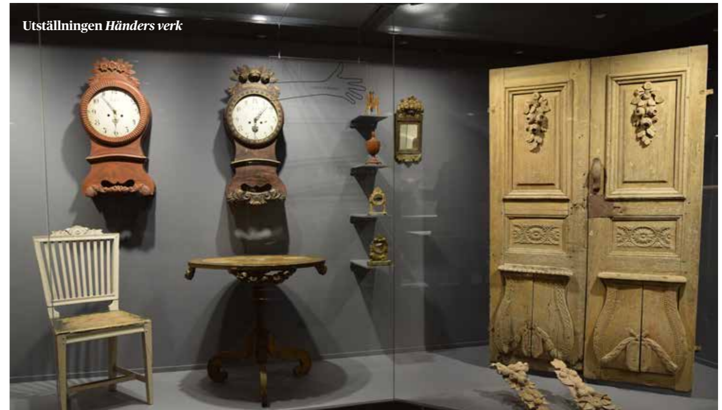
Utställningen Händers verk