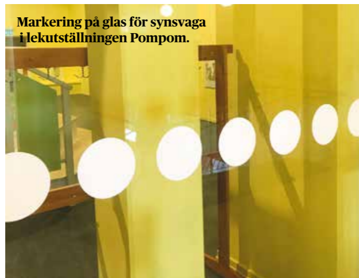
Markering på glas för synsvaga i lekutställningen Pompom.