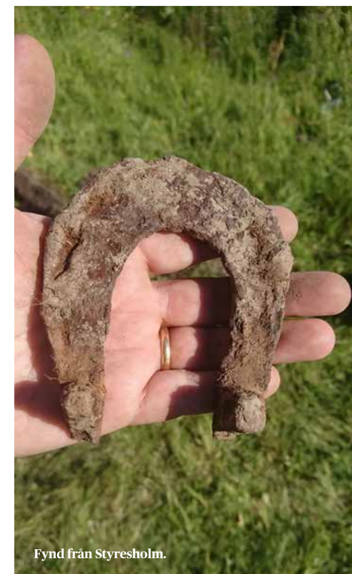
Fynd från Styresholm.

Även en del av en husgrund från 1800-talet framkom men det är oklart om den tillhört en byggnad på den Bünsowska gården. Ett lager sot och kol täckte golvet i grunden och glasflaskor och takpannor som smält av extrem hetta hittades inuti huset, vilket visar att huset sannolikt brann ner år 1888.