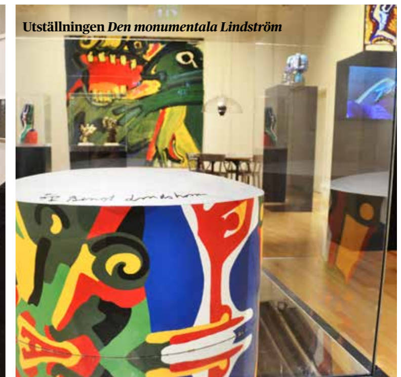
Utställningen Den monumentala Lindström