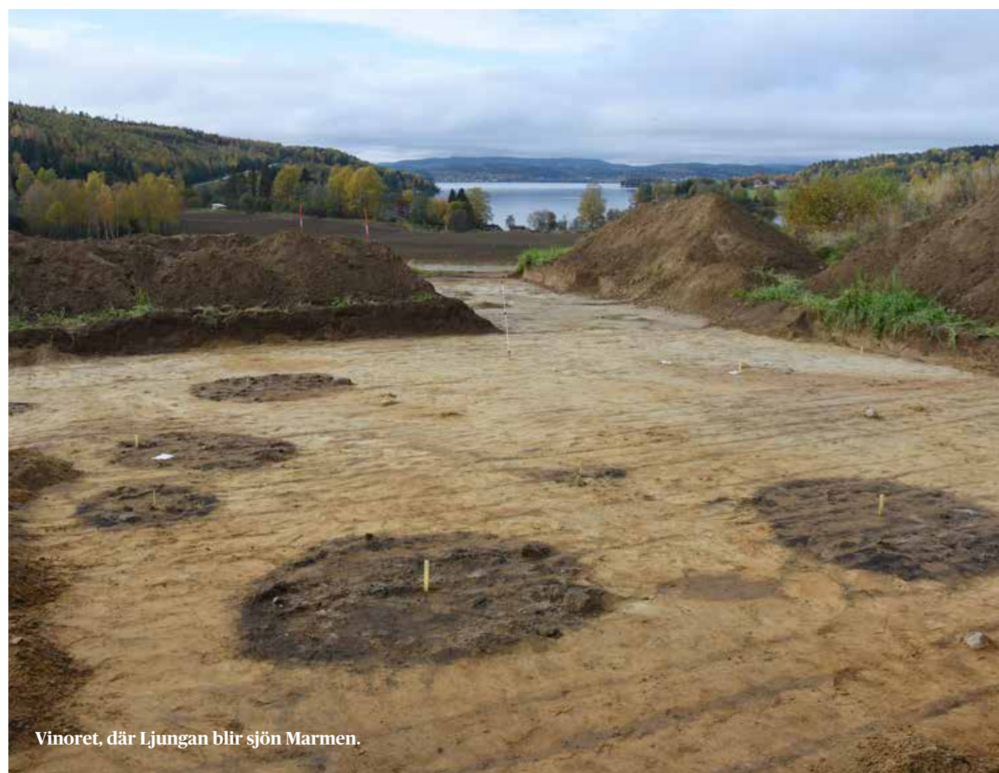
Vinoret, där Ljungan blir sjön Marmen.