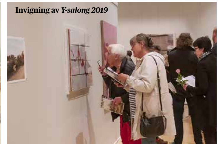
Invigning av Y-salong 2019