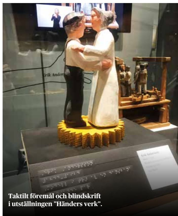
Taktilt föremål och blindskrift i utställningen "Händers verk".