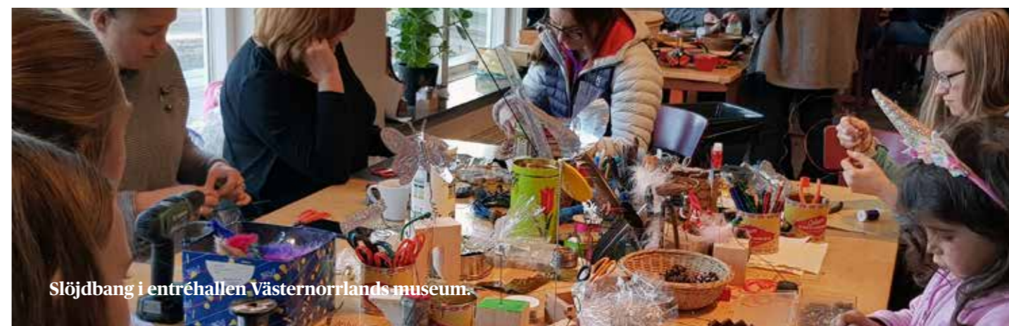
Slöjdbang i entrehallen Västernorrlands museum.

Norge samt Kizhi state museum (Petrozavodsk) och Malaya Korely (Arkangelsk Oblast) i Ryssland. Under våren 2020 skrivs projektets slutrapport.