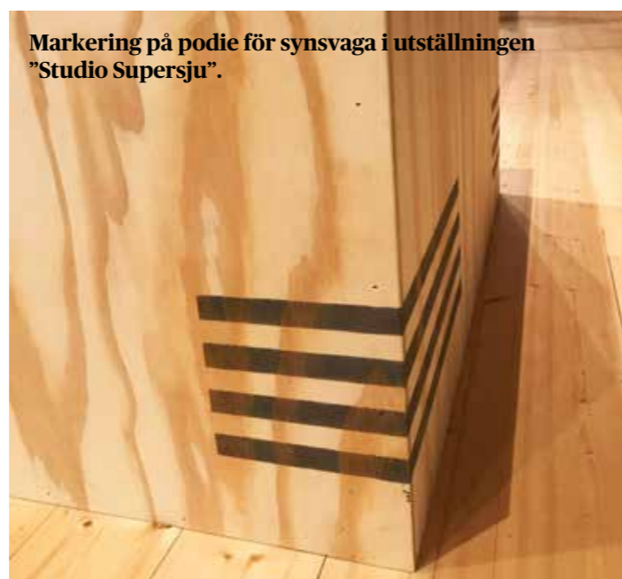
Markering på podie för synsvaga i utställningen "Studio Supersju".