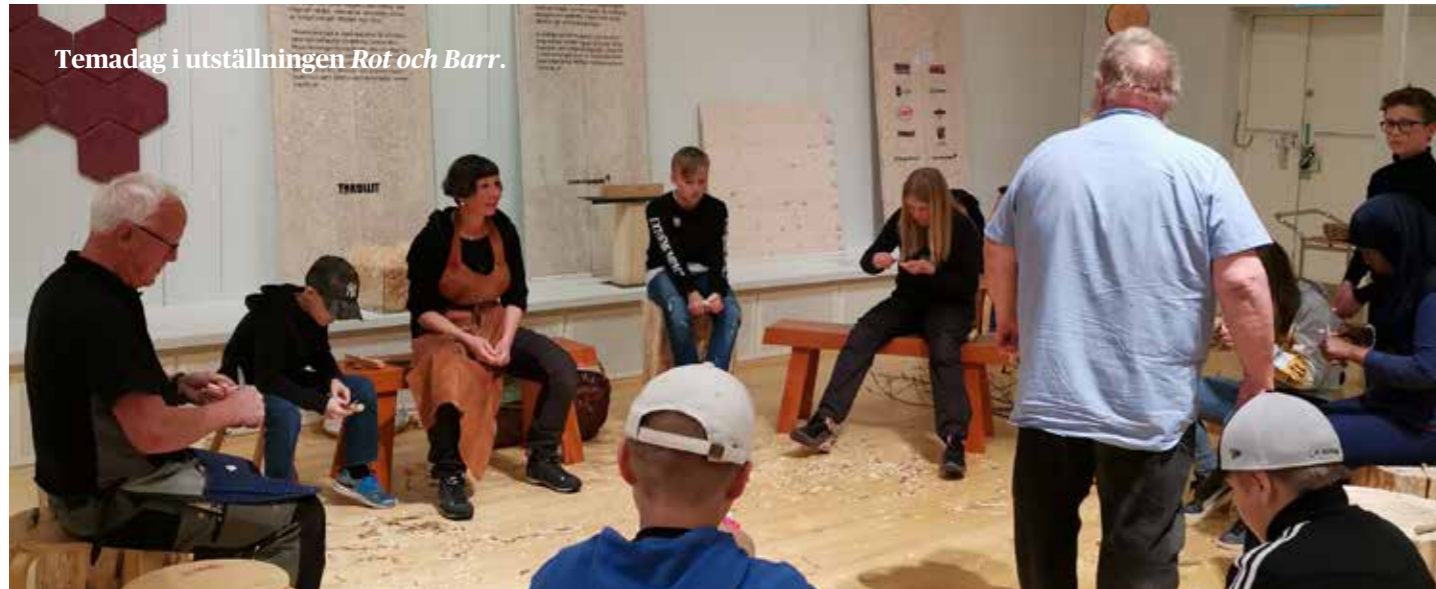
Temadag i utställningen Rot och Barr .

Den publika verksamheten vid museet är omfattande och innehåller de delar som vi brukar benämna utställningar och program. Inom ovan beskrivna verksamhetsområden - inom samlingar, kulturmiljö, byggnadsvård, arkeologi och konservering har museet också ett offentligt uppdrag, något vi brukar kalla publik kunskapsförmedling. En stor del av den publika verksamheten vi erbjuder utformas som utställningar, men också i form av programverksamhet. Ovan har vi också beskrivit det digitala, publika uppdraget. Året har varit framgångsrikt avseende antal besökare, även om antalet besökare i anläggningsstatistiken nått upp till 2018 års nivå. 2019 överensstämmer i besökarantal med åren dessförinnan.