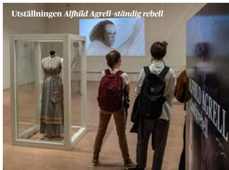
Utställningen Alfhild Agrell - ständig rebell