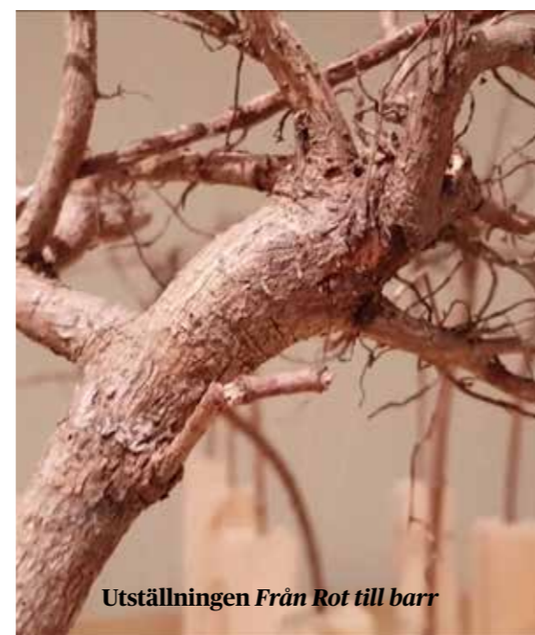
Utställningen Från rot till barr