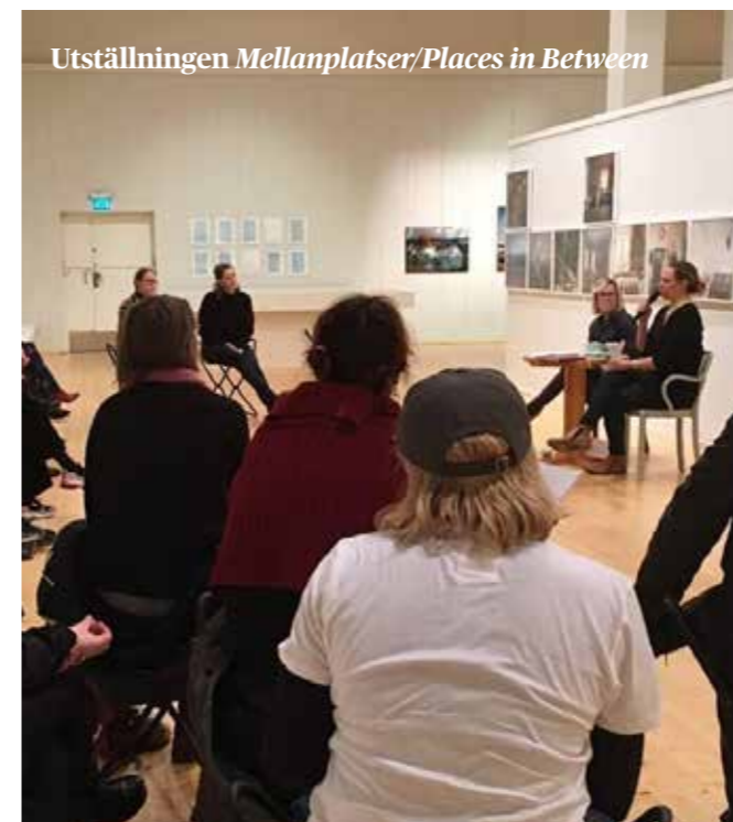
Utställningen Mellanplatser/Places in Between