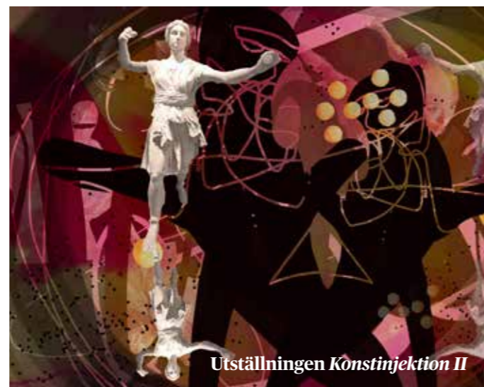
Utställningen Konstinjektion II