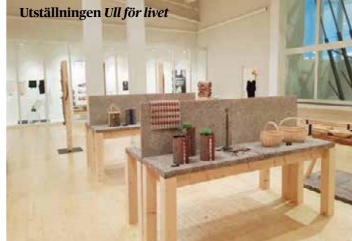
Utställningen Ull för livet

ALFHILD AGRELL - STÄNDIG REBELL 6 september - 10 februari KONSTINJEKTION II - MED ANDRA GLASÖGON 4 oktober 2018 - 13 januari 2019 COUTURE OCH TRASMATTOR 22 november 2018 - 8 mars 2020 TOMTAR PÅ MURBERGET 2 december - 13 januari FRÅN ROT TILL BARR 28 februari - 19 maj ULL FÖR LIVET 4 april - 9 maj DEN MONUMENTALA LINDSTRÖM 9 maj 2019 - 10 januari 2021 POP UP LJUDKONST HOLA FOLKHÖGSKOLA 23 - 26 maj NYINVIGNING PRINS POMPOM 1 juni - tillsvidare Y-SALONG 2019 13 juni - 15 september ARNE JONES VÄRLD 3 oktober 2019 - 4 oktober 2020 (Utställning i Fränsta). MELLANPLATSER/PLACES IN BETWEEN 17 oktober 2019 - 12 januari 2020 HÄNDERS VERK 28 november - tillsvidare