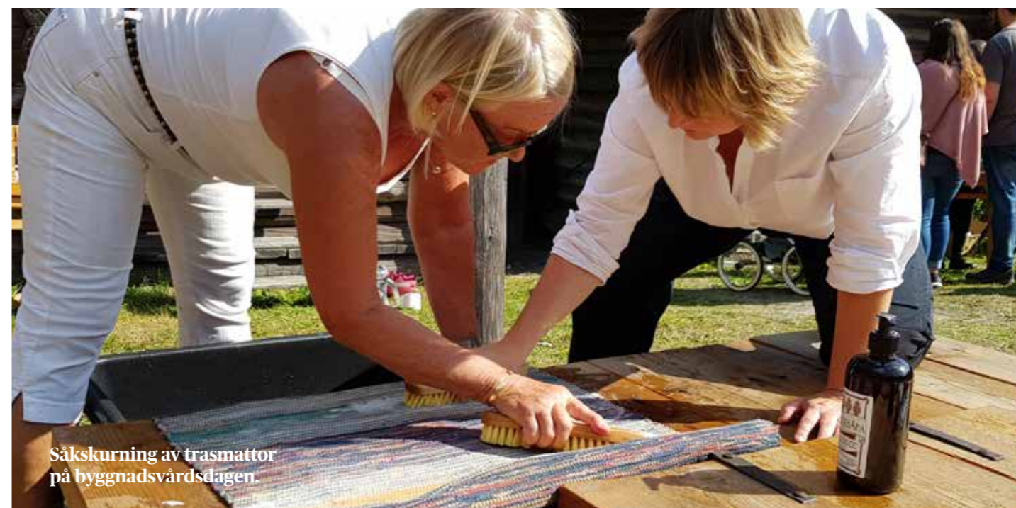
Såkskurning av trasmattor på byggnadsvårdsdagen.

Västernorrlands konsulenter besökte under året Åbo hantverkermuseum och Stundars friluftsmuseum i Korsholm, Finland, Midt-Troms museum i Bardufoss,